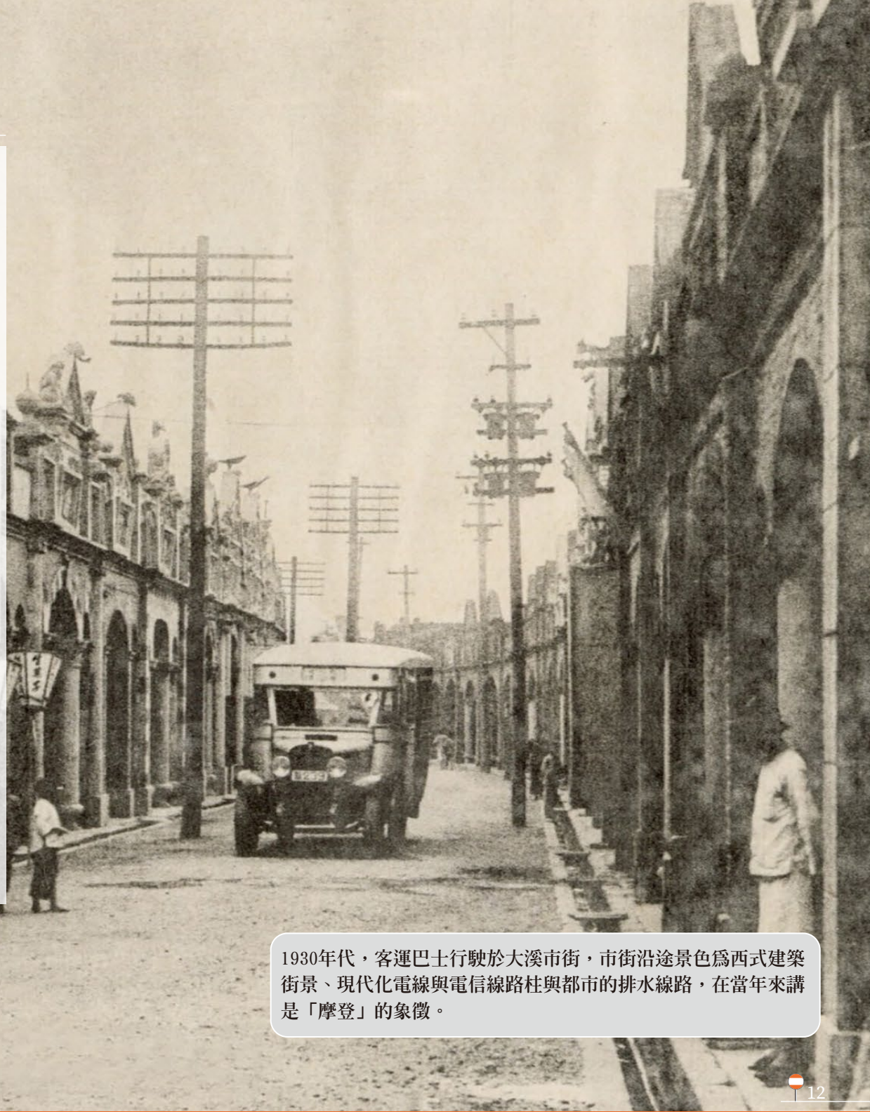
1930年代，客運巴士行駛於大溪市街，市街沿途景色為西式建築街景、現代化電線與電信線路柱與都市的排水線路，在當年來講是「摩登」的象徵。