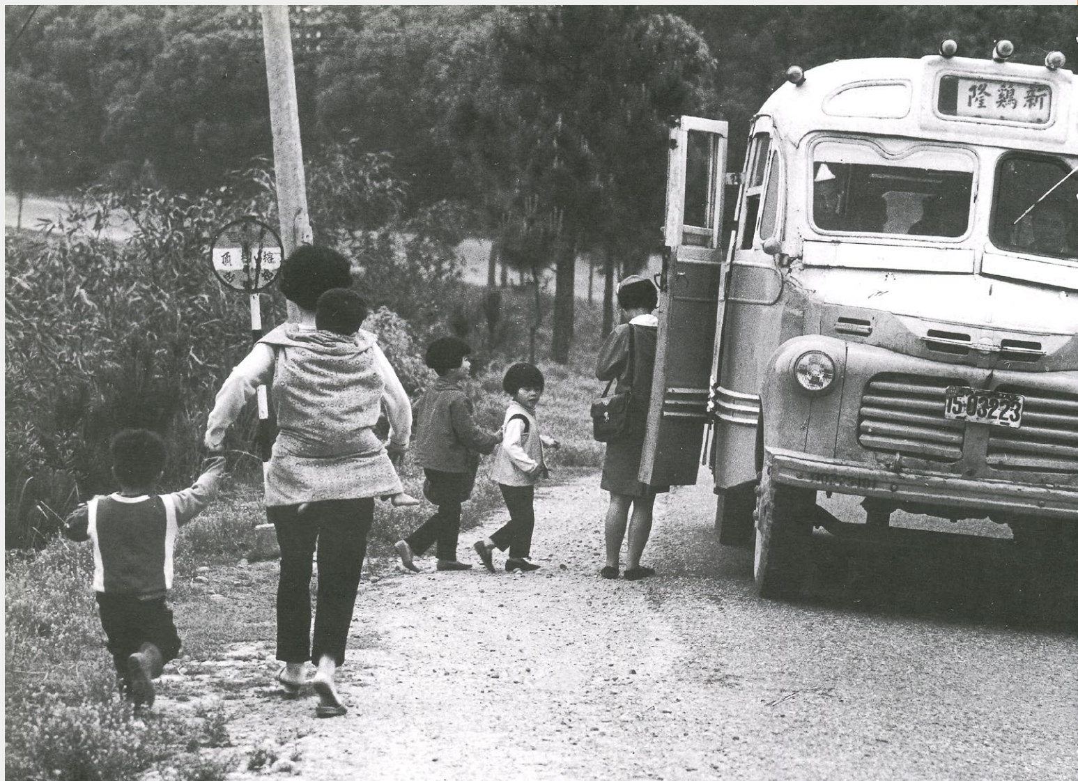
轉妹家 照片拍攝於民國54（1965）年，地點在苗栗縣銅鑼鄉，拍下一輛往新雞隆的客運，客運的車門旁站著一位車掌小姐，揹著幼兒的婦人手牽小男孩，還帶著2個小女孩，趕著搭車返娘家。