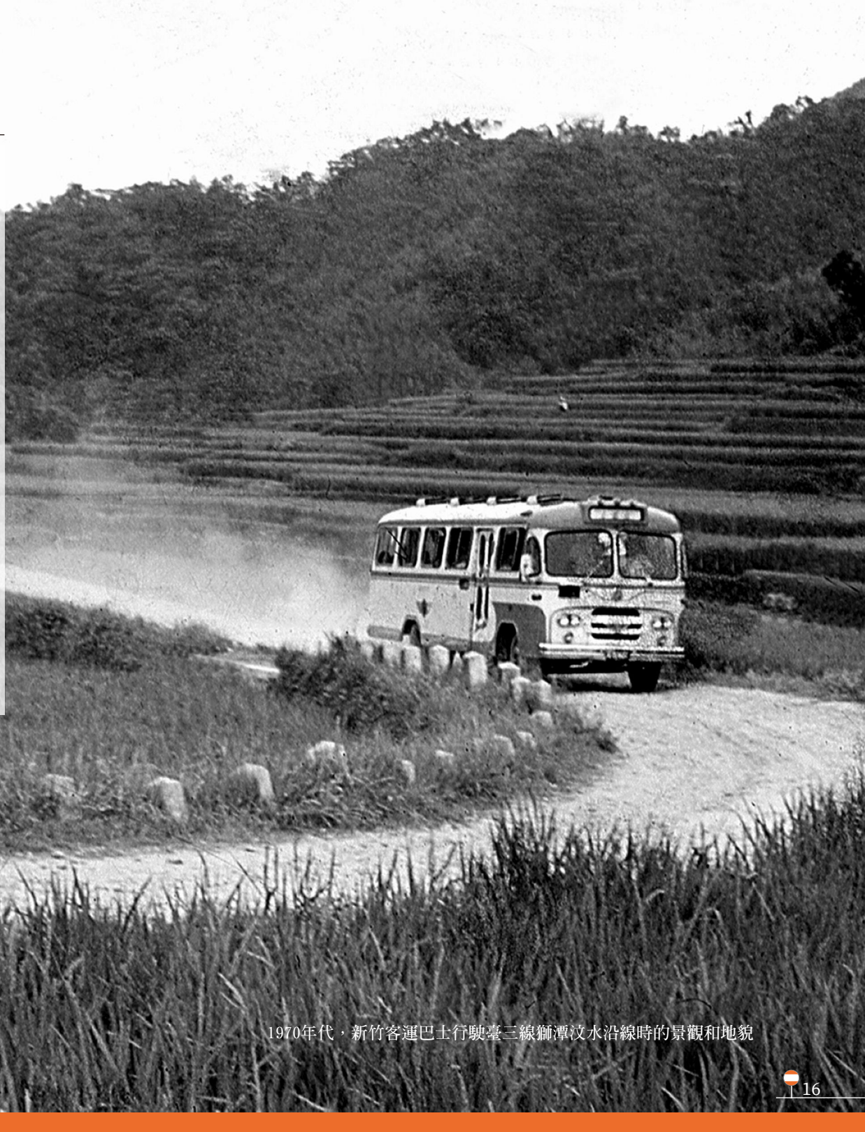
1970年代，新竹客運巴士行駛臺三線獅潭汶水沿線時的景觀和地貌