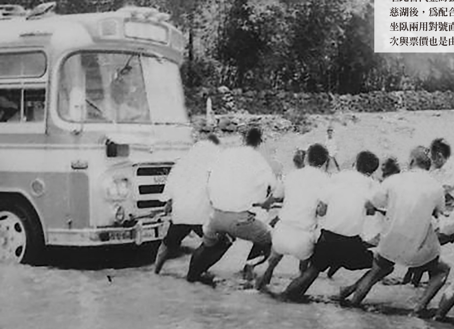
1960年代，新竹客運巴士過河時，遇到尚未架設橋樑路段，車輛困住時，由多人協助拉車脫離河床區域

有關客運的公路監理業務曾有條「國家元首級的路線」以及堪比台汽金馬號的「復興號」班車名稱，當年蔣總統奉厝桃園慈湖後，為配合觀光旅客，桃園客運增開桃園經大溪至復興之坐臥兩用對號直達車，並且命名為「復興號」，這條路線的班次與票價也是由本所核定辦理。