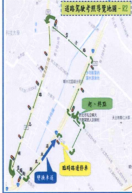
道路駕駛考照 導覽地圖 - R2

起點: 輔大駕訓班 → (右轉) 台麗街 → (右轉) 新北大道 → (右轉) 貴子路 → 貴子路 (執行臨時路邊停車) → (右轉) 三和路 → (右轉) 中正路 → (靠右) 過輔仁大學變換車道 (右轉) 514巷 直行至 (右轉) 巷底 → (左轉) 台麗街 → (右轉) 回駕訓班 終點: 輔大駕訓班