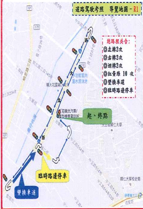
道路駕駛考照 導覽地圖 - R1

起點: 輔大駕訓班 → (右轉) 台麗街 → (右轉) 新北大道 → (左轉) 貴子路 → (左轉) 明志路 → (左轉) 貴陽街 → (左轉) 新北大道 (變換車道) → (右轉) 漢口街 → 漢口街38-40號 (臨時路邊停車) → 漢口街42巷 (左轉) → 直行514巷底 → (左轉) 台麗街 → (右轉) 回駕訓班 終點: 輔大駕訓班