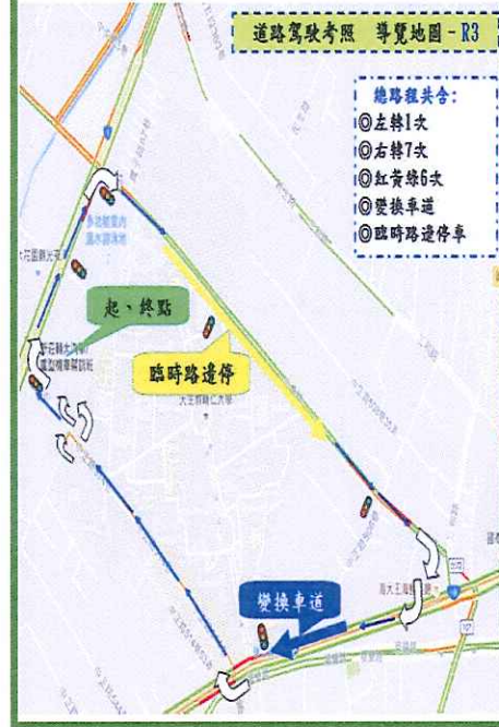
道路駕駛考照 導覽地圖 - R3