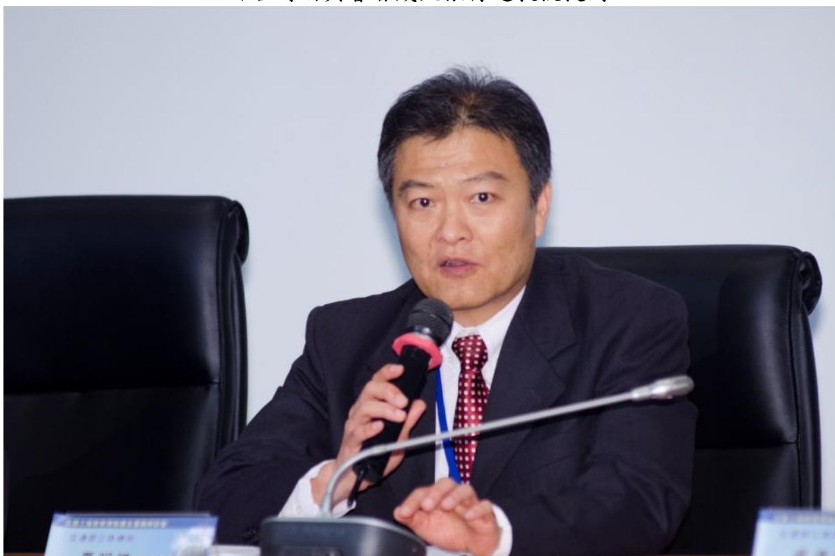
綜合討論主席夏副局長明勝回覆