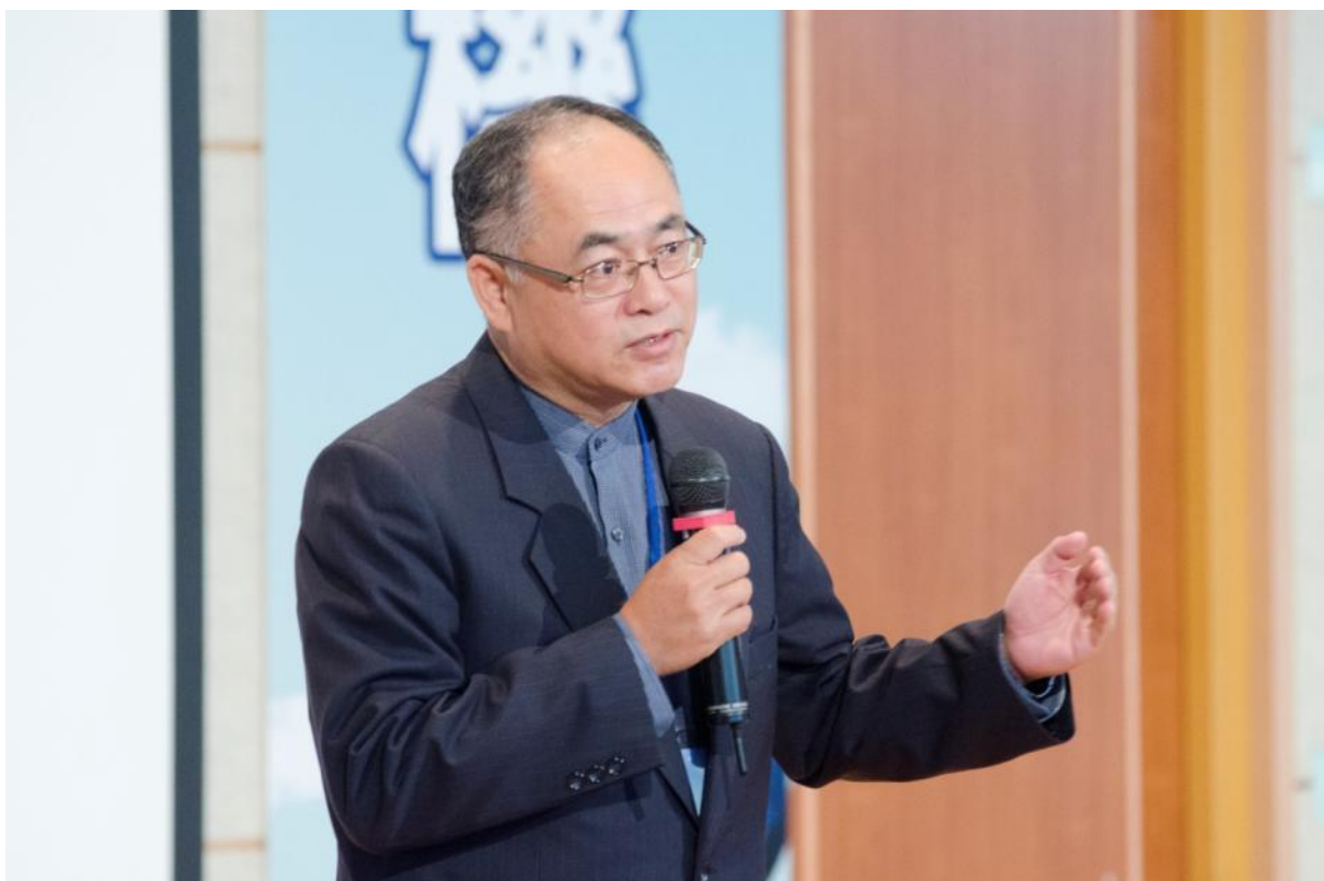
貴賓(交通部吳次長盟分)致詞