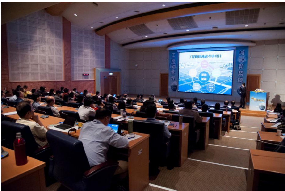
與會來賓座無虛席