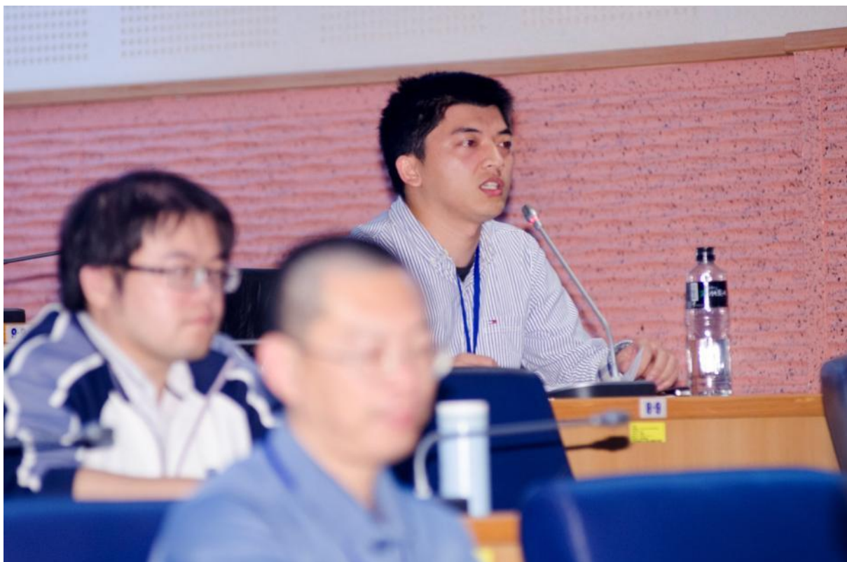
綜合討論與會者中大蔡宗益博士候選人提問