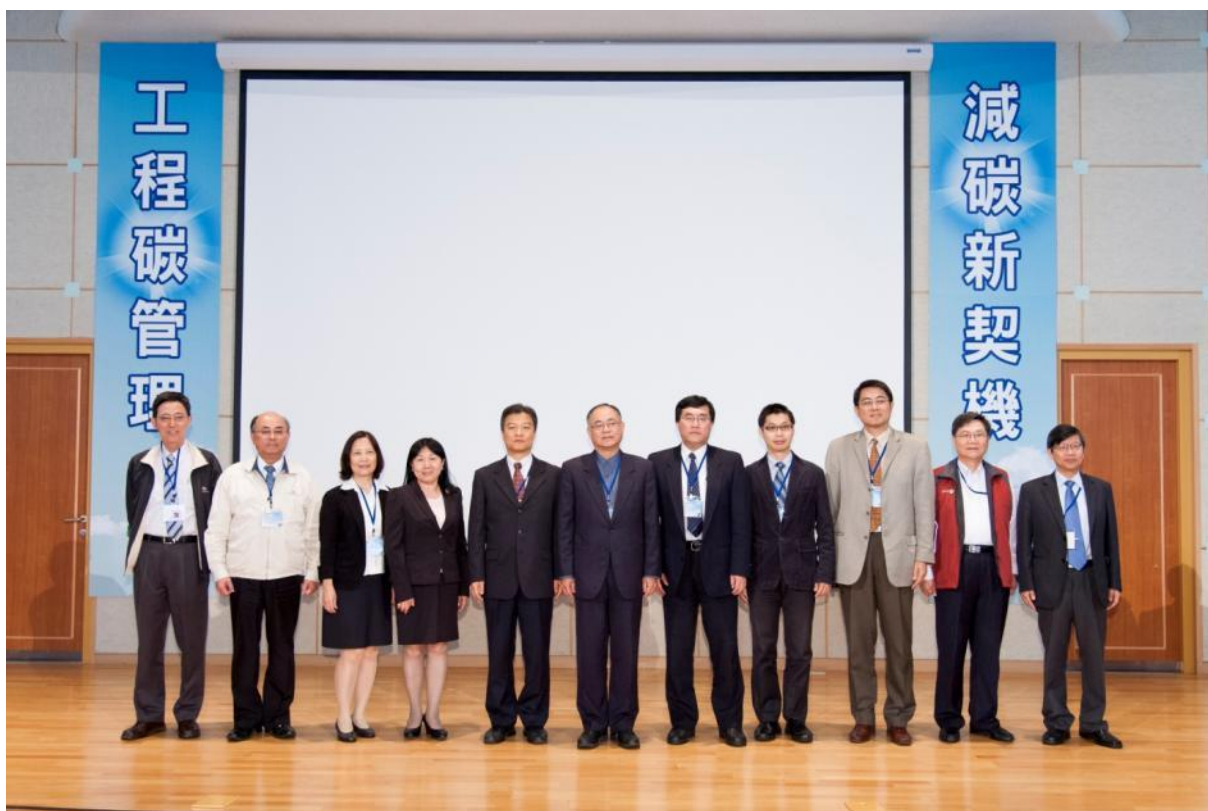
主協辦單位代表、貴賓及邀請講者合影