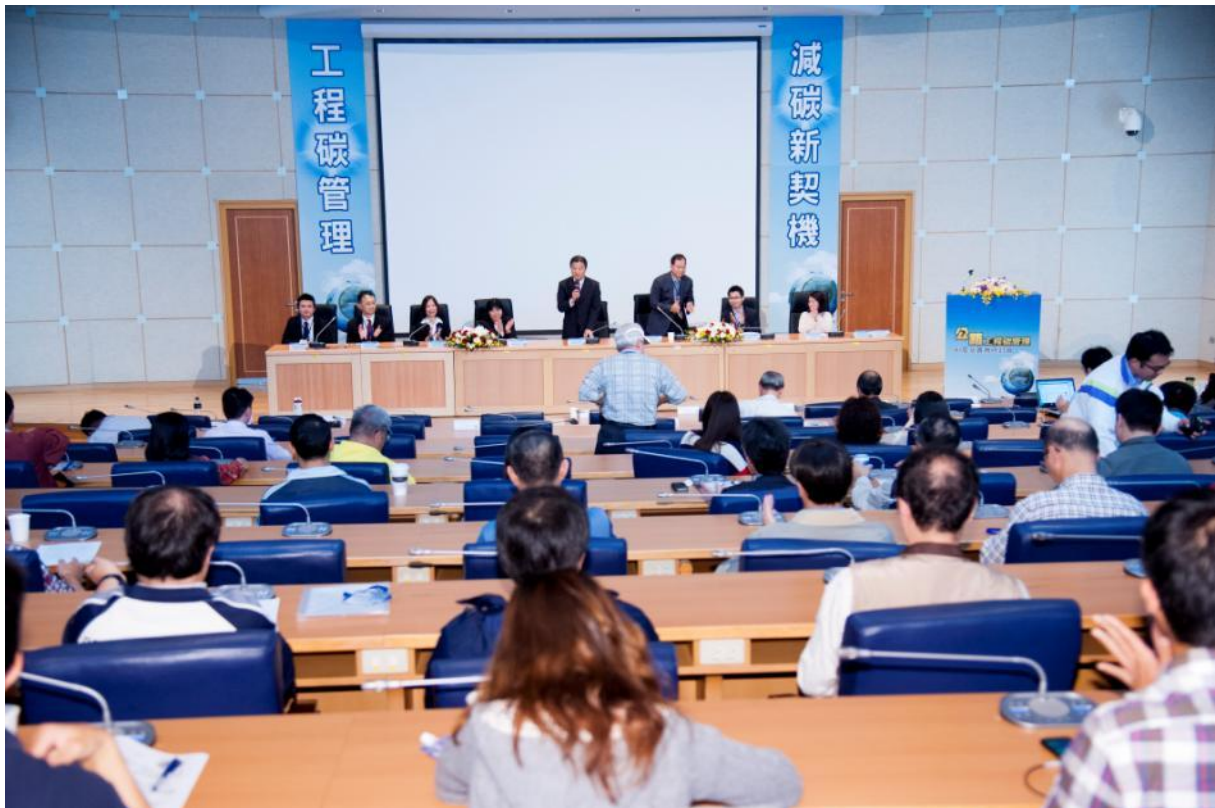
綜合討論主席夏副局長宣布閉幕