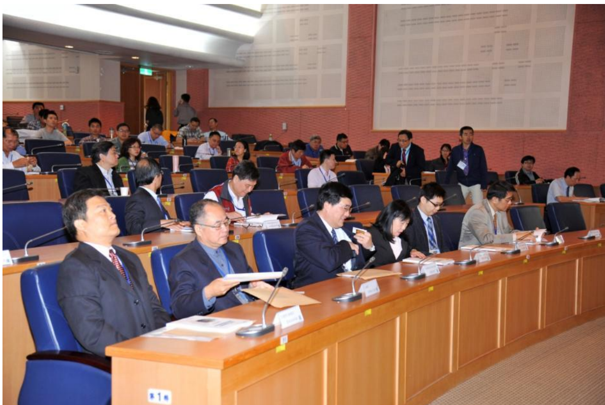
主持人、貴賓及邀請講者入座