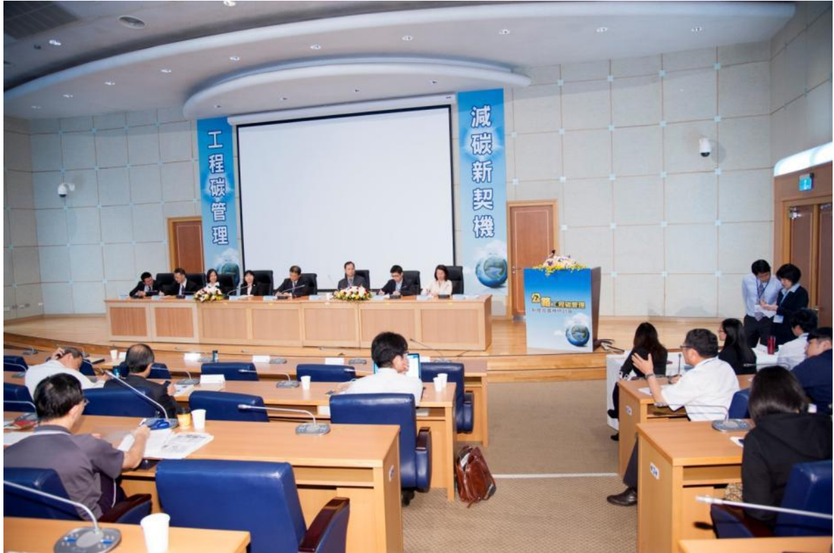
圖 2.4-1 綜合討論實況