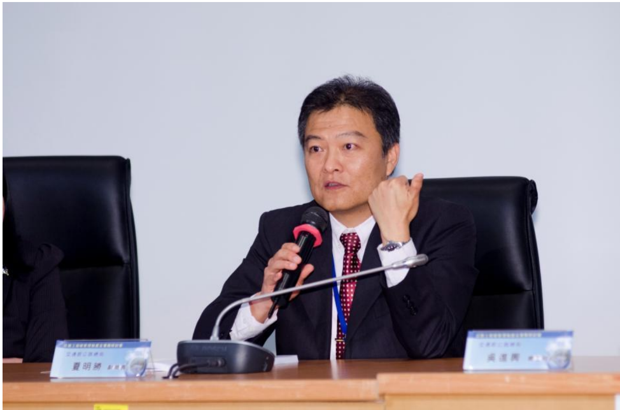
綜合討論主席夏副局長明勝結論