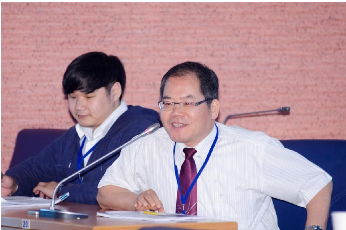
綜合討論與會者成大張行道教授提問