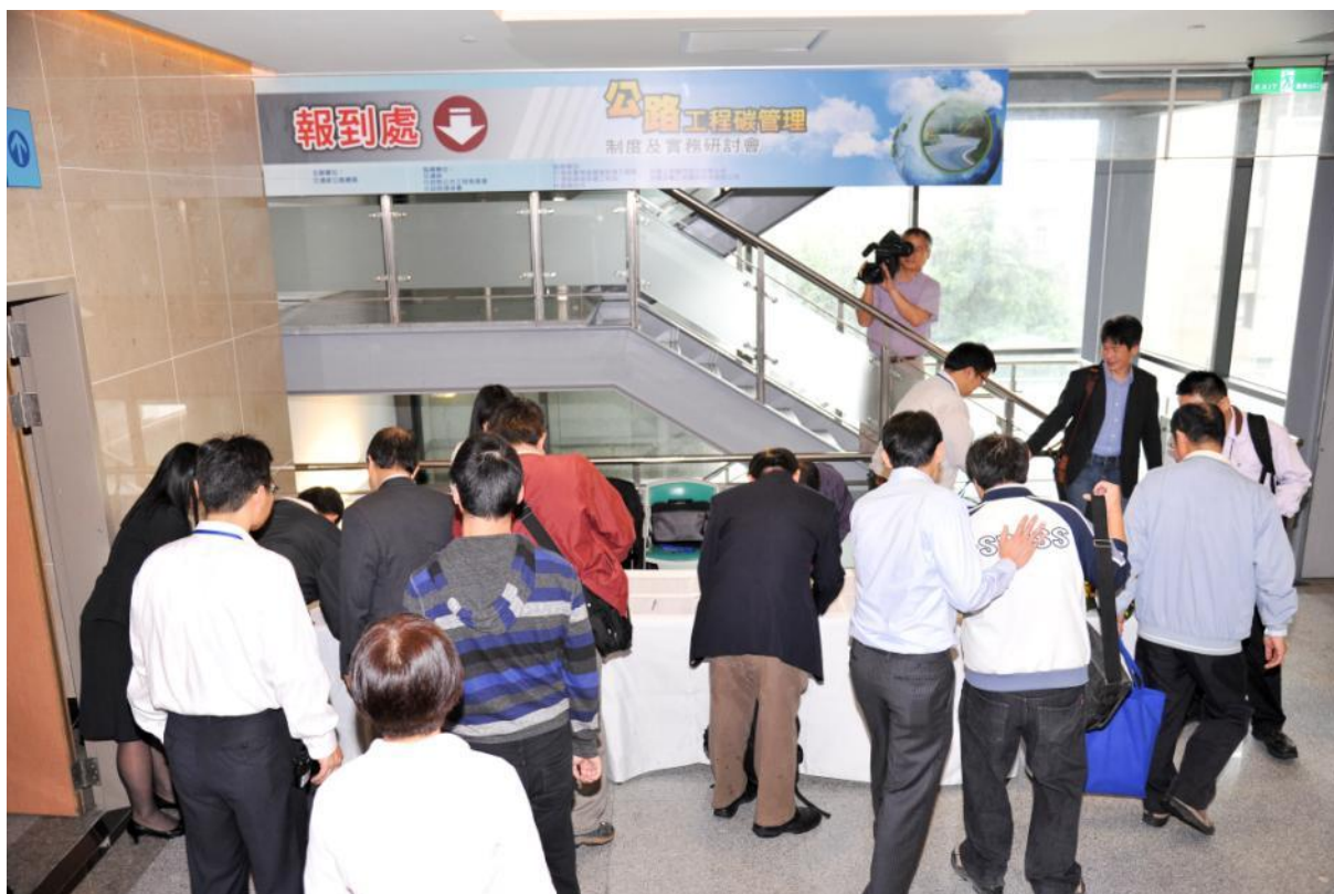
與會來賓於報到處排隊簽到