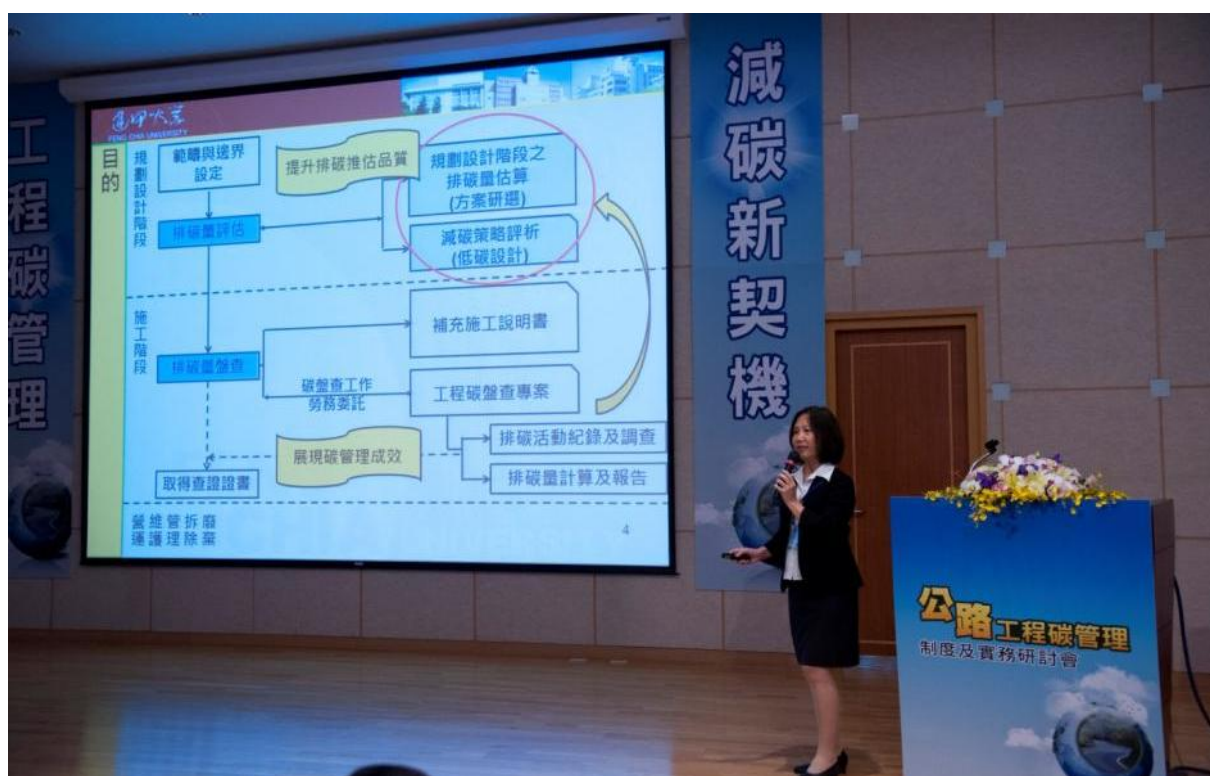
圖 2.2-1 卜君平教授演講實況

最後也針對雲端分析系統介面進行介紹，整體介面設計相當平易近人，讓使用者容易上手。這是國內外唯一以最簡便的方式，又可相當準確計算預力橋梁全生命週期碳足跡的系統，將有助於從節能減碳的觀點做各項方案比較與選擇，未來將藉由更多的碳盤查資料，持續修正碳排量的計算。