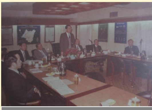
交通部連戰部長蒞臨本所視察，於簡報室向與會人員指示