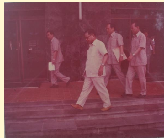
交通部林部長蒞臨 本所視察→