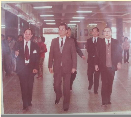
交通部連戰部長蒞臨本所視察一樓作業窗口