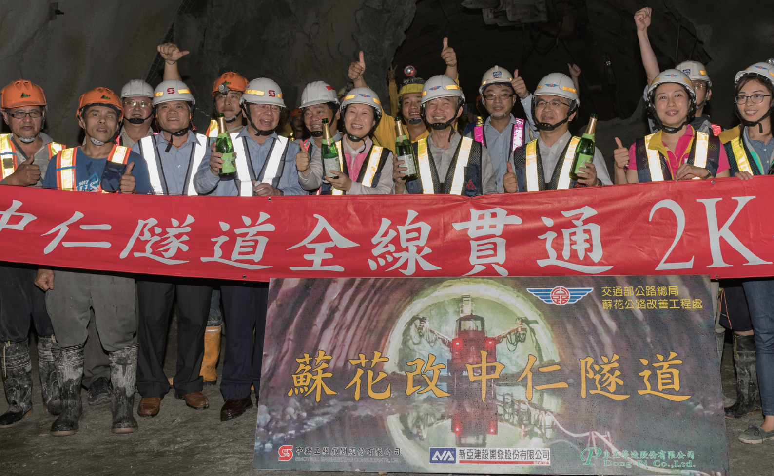
舉行爆破貫通儀式後工程人員在隧道內歡呼合影。

蘇花改中仁隧道工程於 107 年 5 月 6 日北上線上半斷面貫通後，緊接著南下線也在 107 年 5 月 25 日貫通，這是蘇花改全部八座隧道中第七座貫通的隧道，也象徵著蘇花改計畫又往前邁進了令人振奮的一大步。