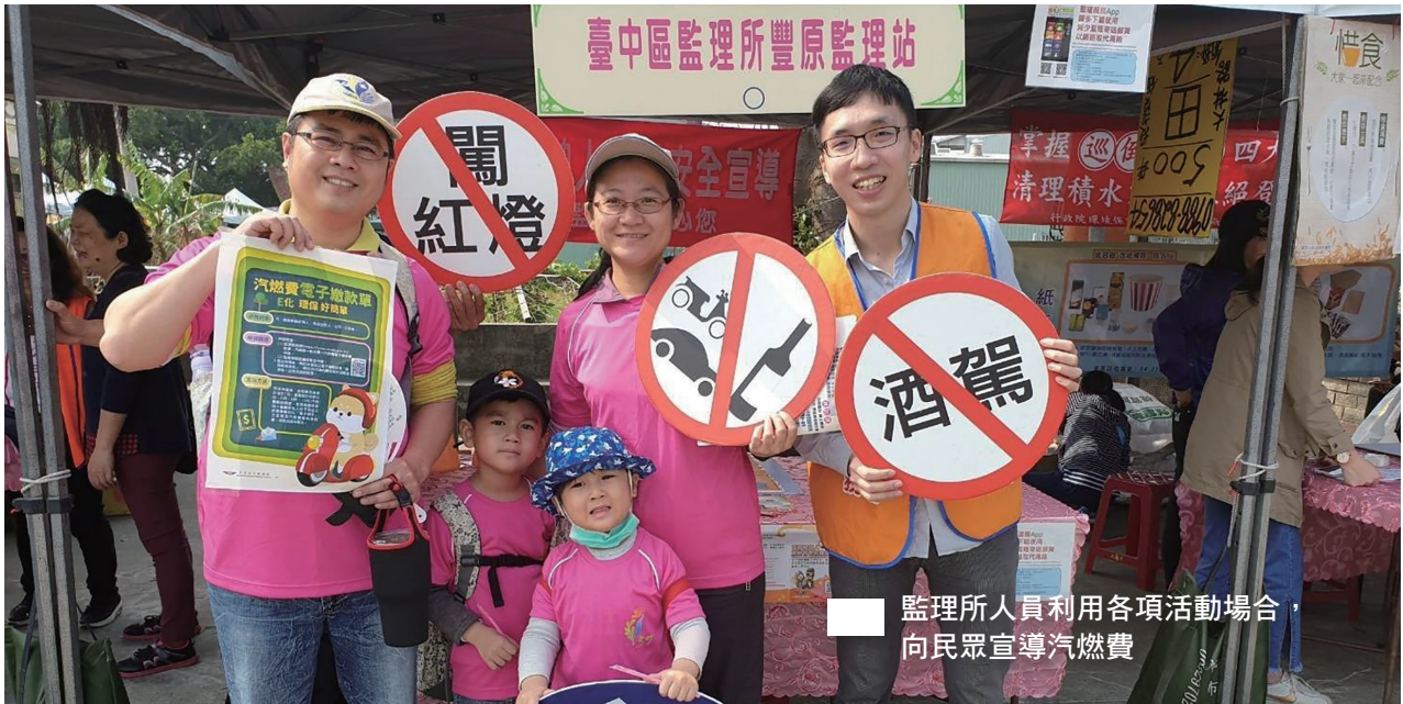
監理所人員利用各項活動場合，向民眾宣導汽燃費

帳號扣款，不管車主本人或其他人的帳戶都可設定扣款，扣款成功會接到通知，民眾免因遲繳而受罰，除了節省繳費時間，亦可避免耗費資源，為環保愛地球共盡心力。