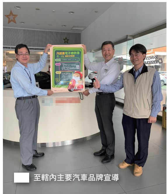
至轄內主要汽車品牌宣導

在宣導之餘直接請現場有意申請的民眾填寫申請書表，更在轄區內各代檢廠、駕訓班、客運場站等人潮匯聚之處，廣為張貼海報加強宣導，希望將訊息的種子，散播到更多的民眾心中，進而加深民眾申請的意願，更提升汽燃費開徵的繳款率。