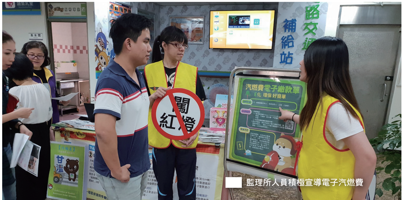
監理所人員積極宣導電子汽燃費