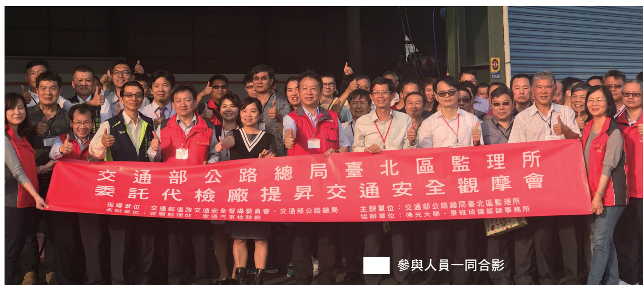
參與人員一同合影

本次更利用現有場地規劃「大車視野死角及內輪差」的戶外教學，透過實車動態體驗，讓學生和民眾能建立起正確的交通安全觀念。「一個人走得快，一群人走得遠」，期許大家攜手合作守護交通安全，以「零事故傷亡」作為我們終極目標。