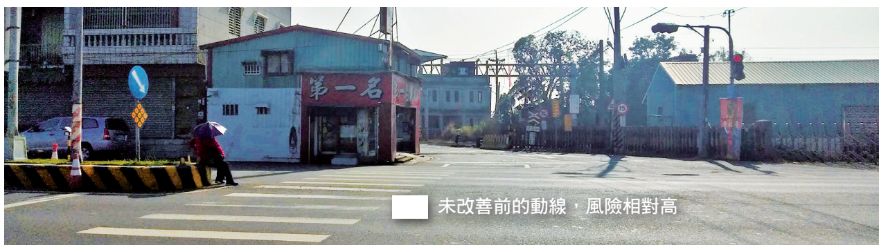
未改善前的動線，風險相對高

邇來接連發生行人在行穿線上遭撞喪命事件，對行人的防撞保護趨近於零。公路總局第五區養護工程處水上工務段於台1線高齡者穿越需求量大之路口，設置行穿線庇護島，以降低行人交通事故。