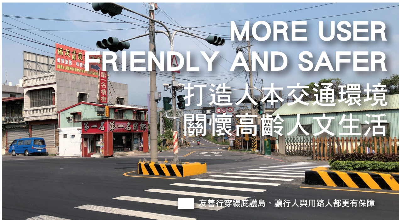
友善行穿線庇護島，讓行人與用路人都更有保障