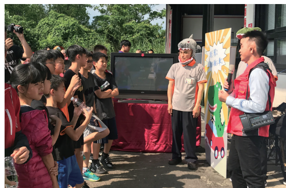
現場解說道路上的安全觀念與模擬

代檢廠在過去的印象往往僅是提供車主定期檢驗，而家通代檢廠與傳統印象最大的差異：不但於驗車時免費提供