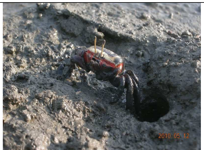
生物照-弧邊招潮蟹