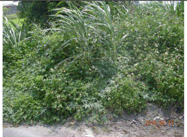
樣區三 5月以牛筋草為優勢