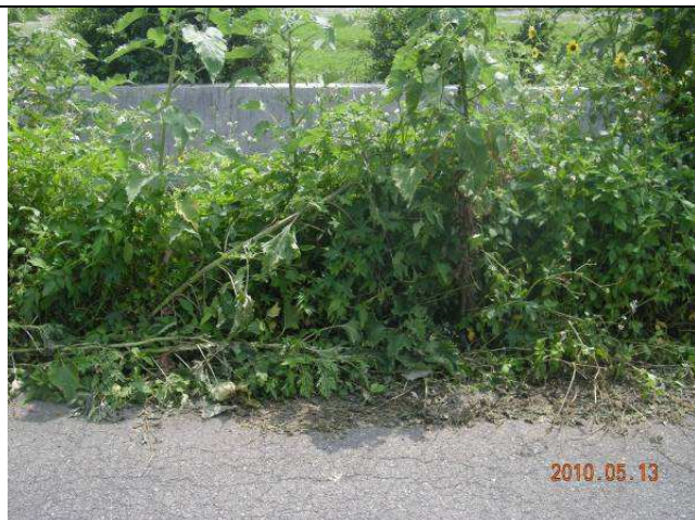
樣區四 5月以大花咸豐草為優勢