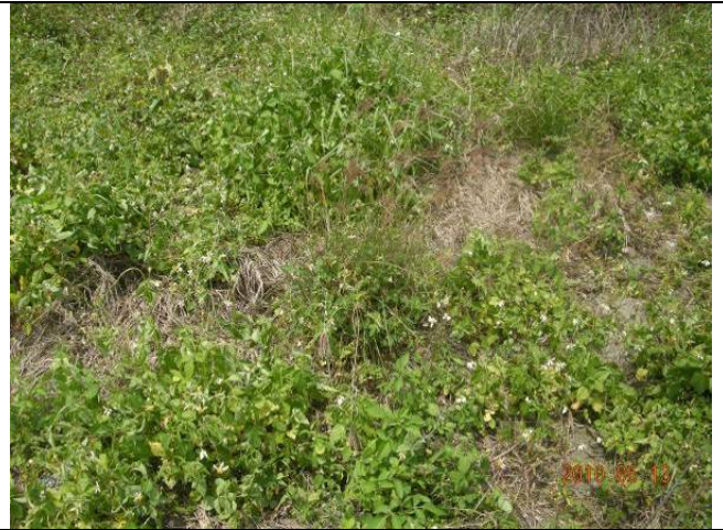
樣區一 5月以牛筋草為優勢