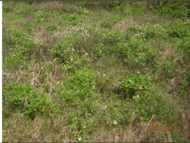
樣區一 4月以牛筋草為優勢