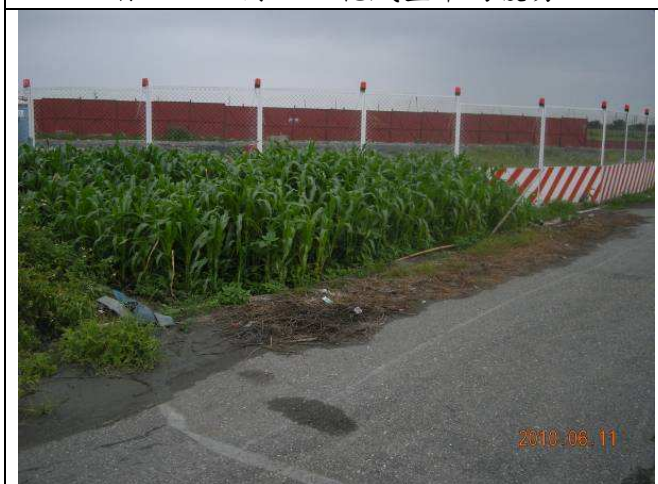
草生地於施工中較易受到人為干擾