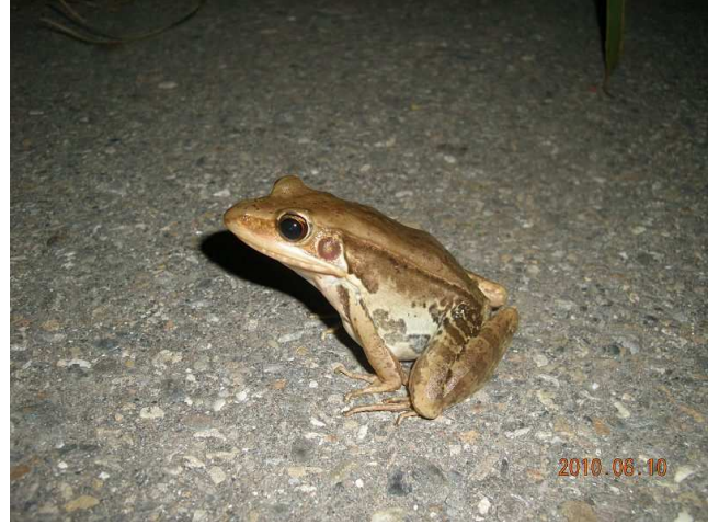
生物照-貢德氏赤蛙