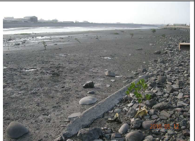
水域測站環境照-福寶橋