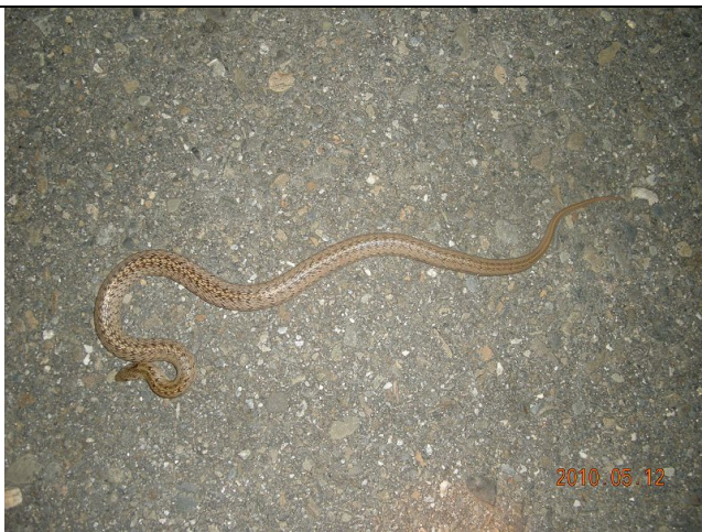
生物照-赤背松柏根