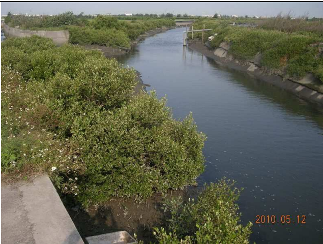
水域測站環境照-福豐橋