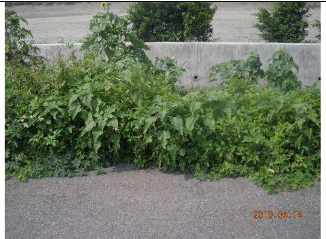
樣區四 4月優勢種為大花咸豐草