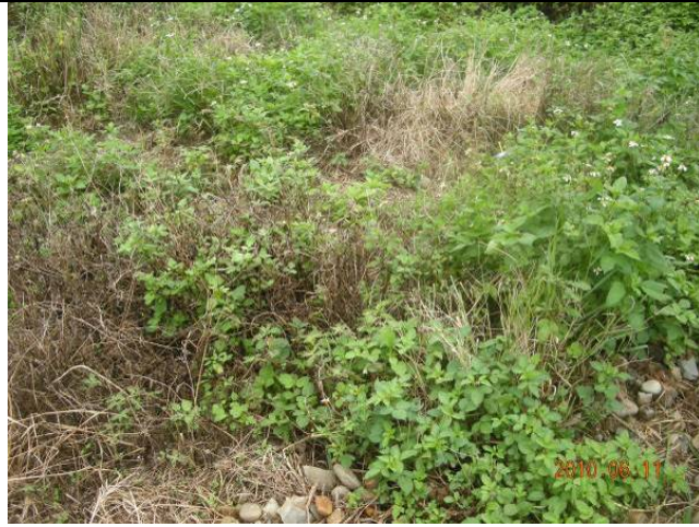
樣區一 6月以大花咸豐草為優勢