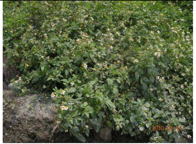
樣區二 4月優勢種為大花咸豐草