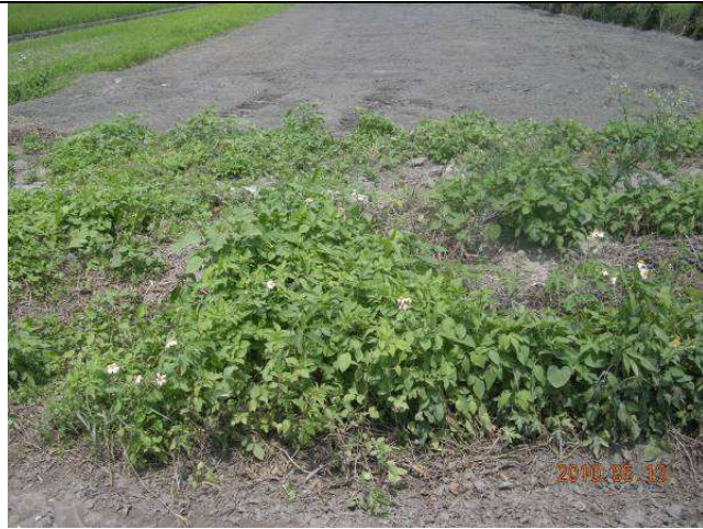
樣區二 5月以大花咸豐草為優勢