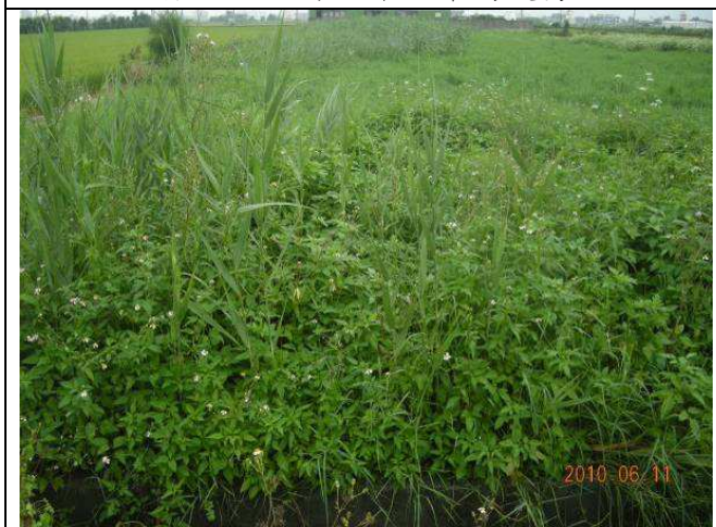
樣區五 6月以大花咸豐草為優勢