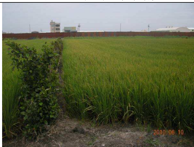
計畫區內作物多以水稻為主