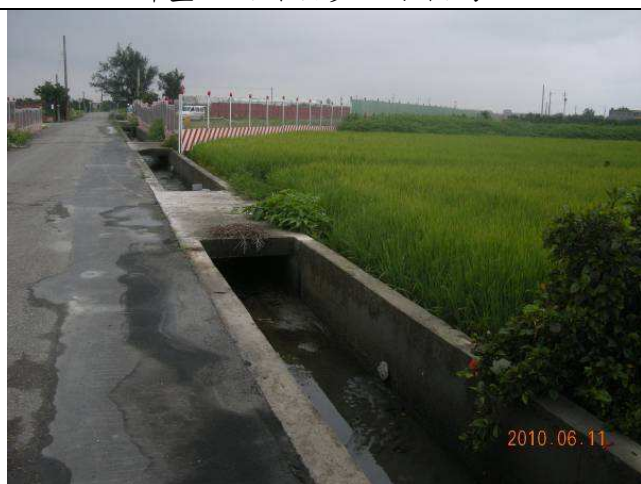
陸域調查樣線2環境照