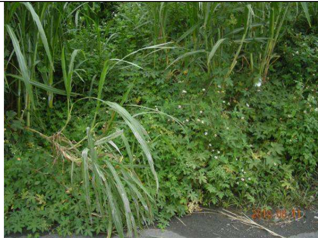
樣區三 6月以大花咸豐草為優勢