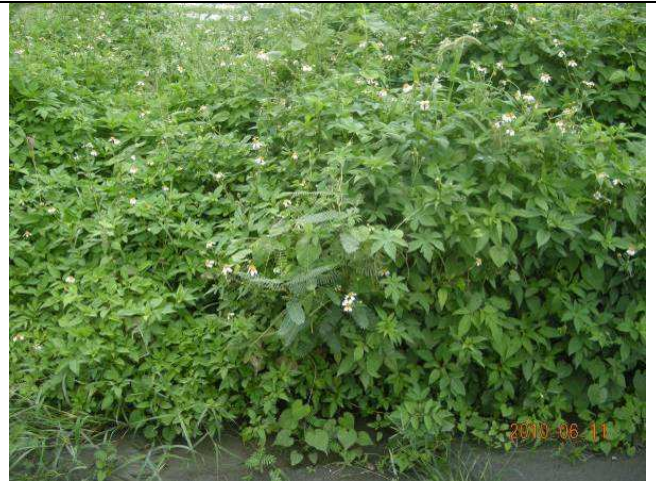
樣區二 6月優勢種為大花咸豐草