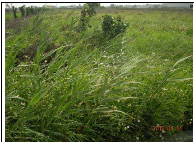
樣區五 4月以牛筋草為優勢