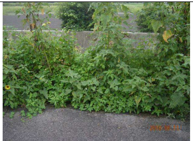
樣區四 6月優勢種為大花咸豐草