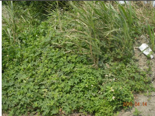
樣區三 4月以牛筋草為優勢