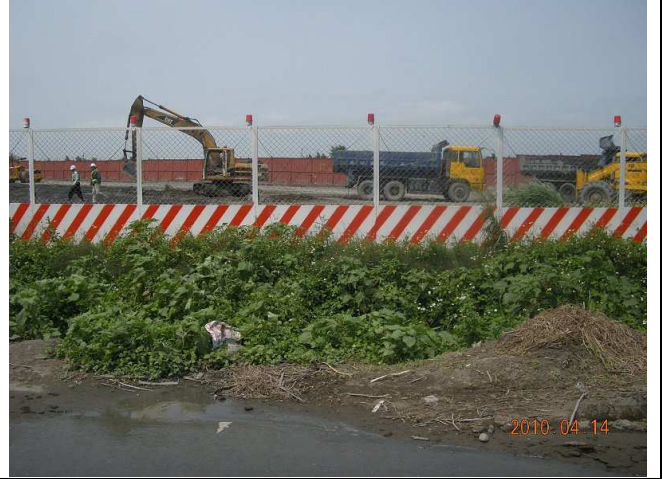
陸域樣線環境照-施工情形