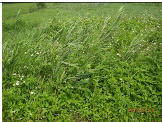
樣區五 5月以牛筋草為優勢