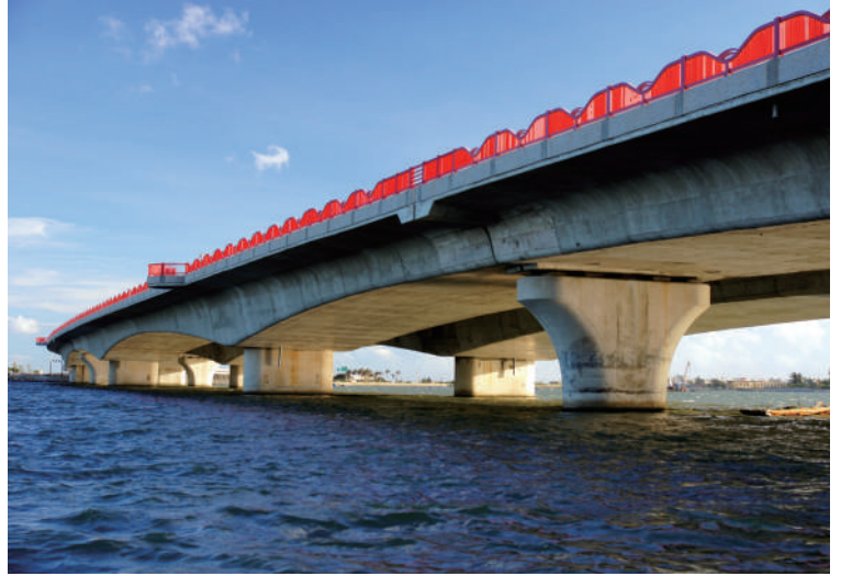
臨近生態棲息地的橋樑以加大跨距的設計，降低對環境生態的衝擊。