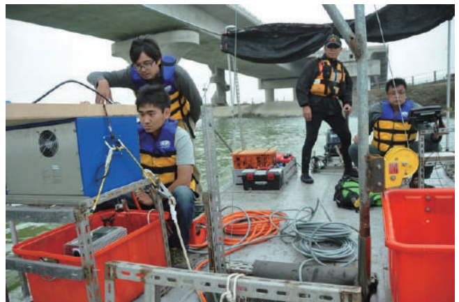
八棟寮至九塊厝路段在水域施工時，特別聘請水下考古專家監看，以保護文化資產。

大甲大安路段十年前地方民眾抗議高架化，不利在地經濟發展，該路段因此將高架改為平面道路。通車後卻因肇事率高、死傷車禍不斷，在當地民意