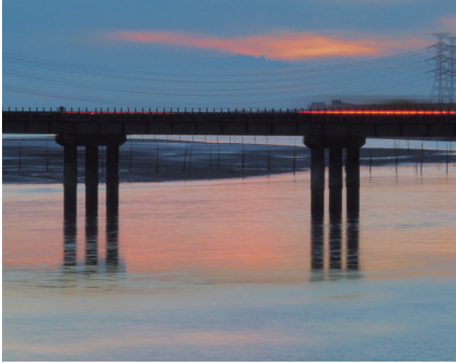
台 61 線的橋樑簡化造型設計，美觀也大幅提升。