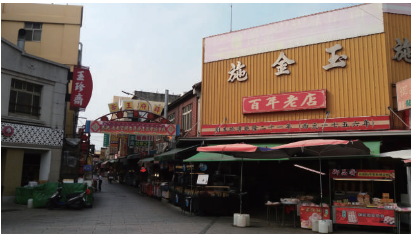
鹿港的百年香舖見證了當地千帆雲集、香火鼎盛的繁華歷史。

在這裡，村民們於正月與秋收之後，都有請「太平媽」到村莊作客的習俗，俗稱「謝平安」。而太平媽出巡，則稱為「太平媽巡田水」，是全臺唯一在農曆 9 月農作物收成後，舉行的出巡遶境活動。路線不同於一般宗教慶典的單點式往返。而是具有濃厚的在地特色。「巡田水」這三個字，也可以付思人們與媽祖的關係：想想看，太平媽可是每一分稻田、每一條田梗都仔細看過呢，西螺米又怎麼會