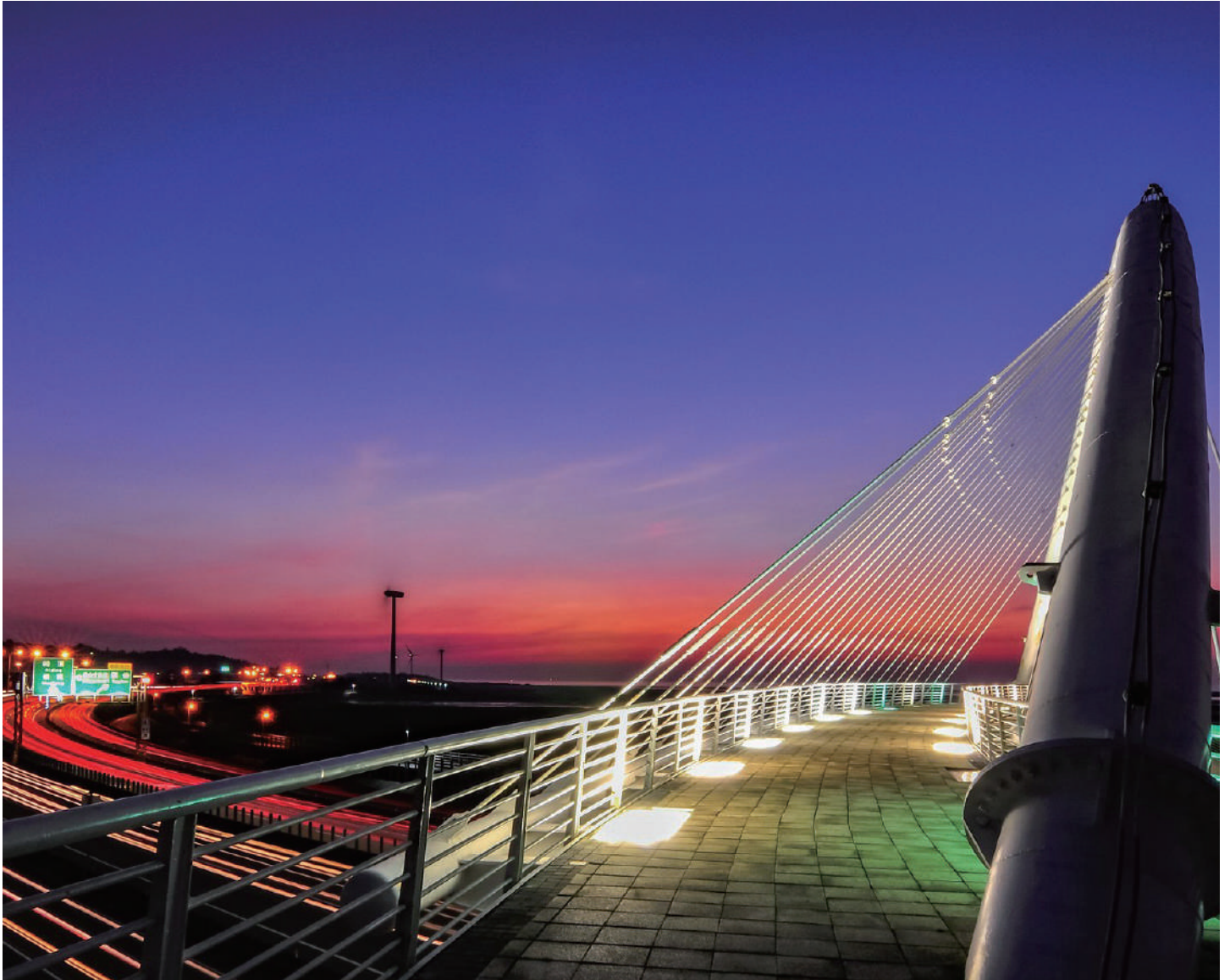
車流量少又有海天美景相伴，夕照與夜色更是醉人，讓台 61 線成為旅人們喜愛的兜風路線。