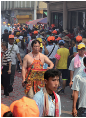
在神輿的隊伍中，常見乩童的身影。