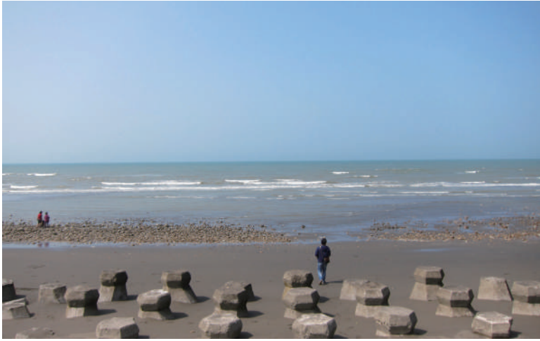
公路沿線連結了海洋與陸地的美景，親海是如此便利。