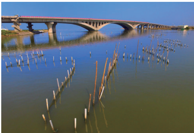
七股溪橋臨近重要生態保育及文化考古區，因此在橋梁設計及施工上必須力求降低對環境的影響。

從員林大排至西濱大橋路段，該路段屬生態敏感區域；而八棟寮至九塊厝路段，因穿越臺江國家公園，南臺灣宜人氣候哺育著七股豐富的濕地生態，