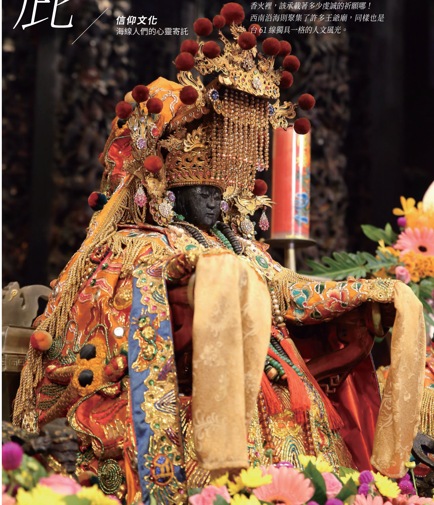
媽祖是西海岸人民的守護神，台 61 沿線布滿大大小小的媽祖廟。

台 61 線緊貼著海岸線，海洋該餵飽多少人家呀。只是海也是無情的，討海人又怎麼能與巨浪拚搏？莫不過期待媽祖婆的神庇庇護……大甲鎮瀾宮、鹿港天后宮，鼎盛香火裡，該承載著多少虔誠的祈願哪！西南沿海則聚集了許多王爺廟，同樣也是台 61 線獨具一格的人文風光。