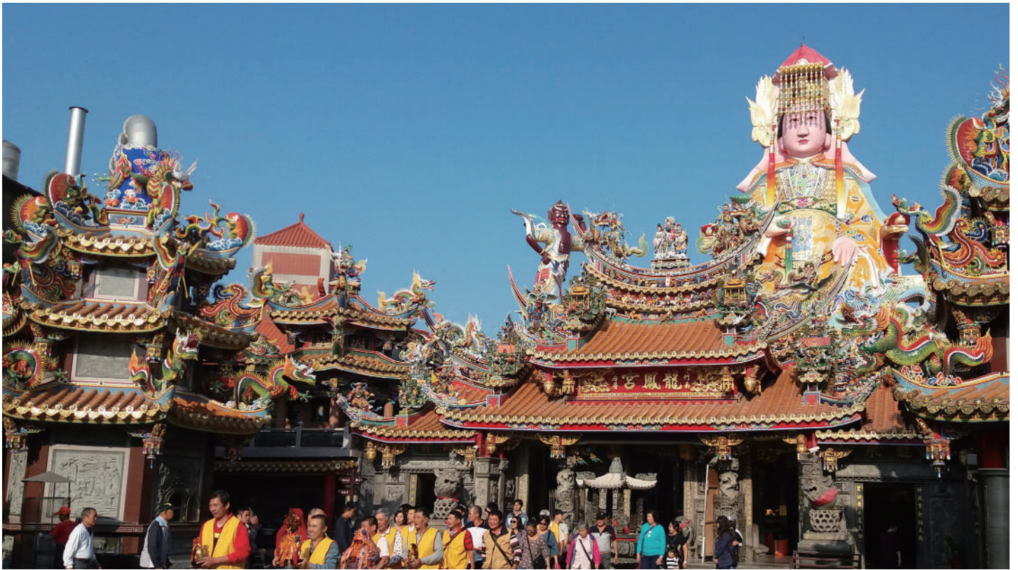
竹南龍鳳宮有著世界最大的媽祖神像，相當醒目。