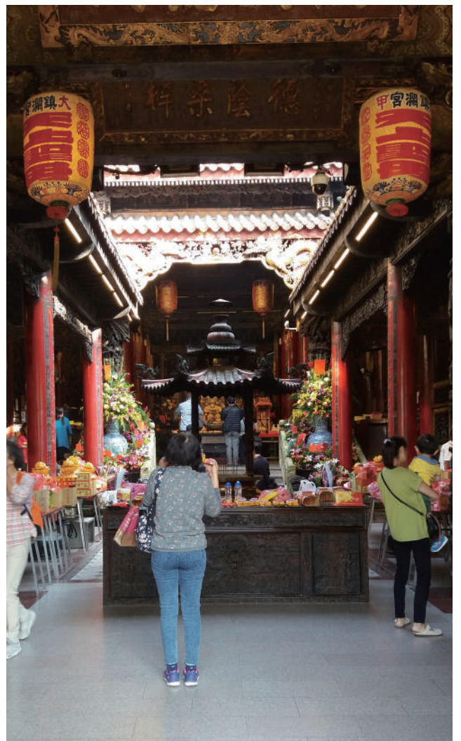
大甲鎮瀾宮是全臺媽祖信仰的重鎮。

龍鳳宮一直是當地居民的信仰中心，也是竹南的地標，更與當地的中港慈裕宮合稱為「內外媽祖」。媽祖廟宇向來每年都會舉辦遶境活動，以巡視轄區是否一切平安順利。「內外媽祖」的遶境，曾經停辦了 22 年，到了 2019 年才復開始遶境，對所管轄的 53 庄一一巡視。遶