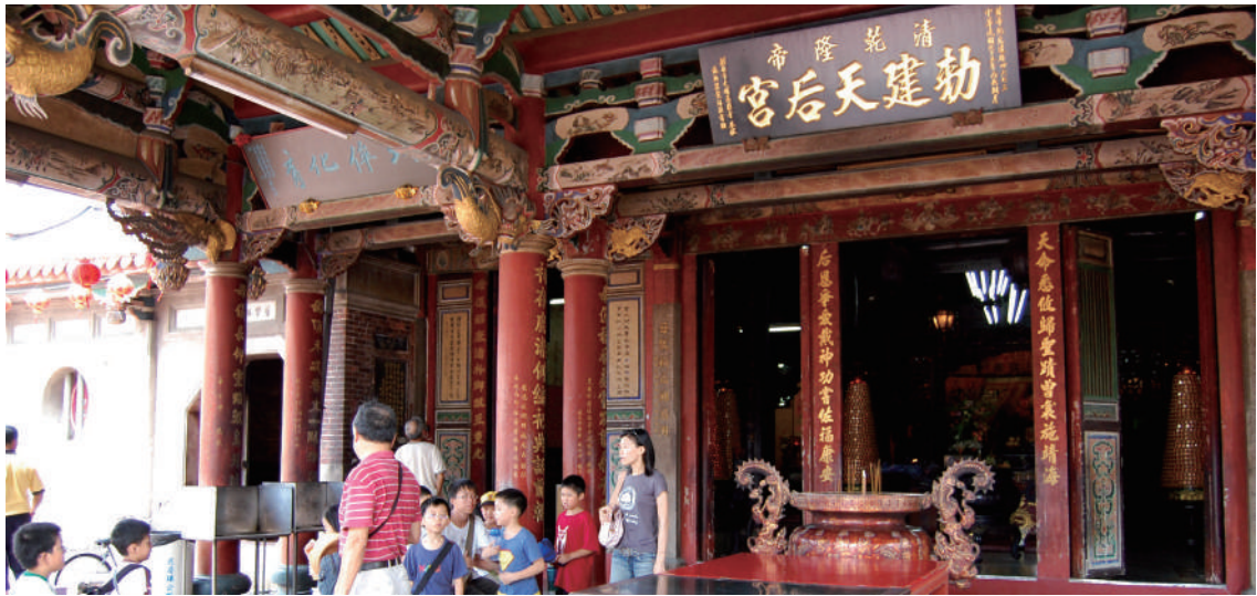
新祖宮為清官方所建的天后宮，現貌為民國 59 年全面重修。