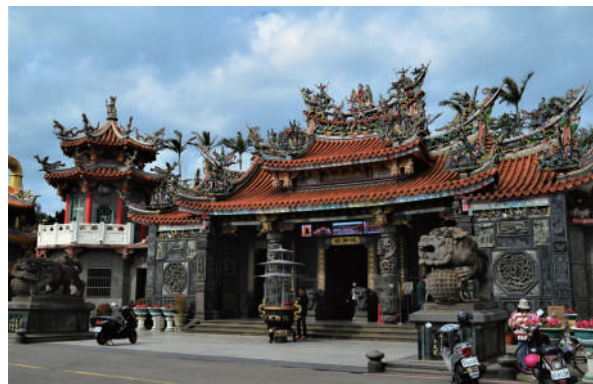
香火鼎盛的新豐池和宮奉祀池府王爺，是全台王爺信仰的重鎮。由於附近還有紅毛港遊憩區、新豐紅樹林等景點，亦是台 61 線旁重要的休憩景區。