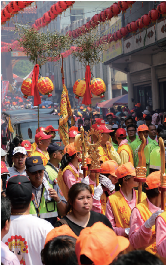
信眾浩蕩的隊伍可見信仰的力量，也是西濱住民們的心靈寄託。