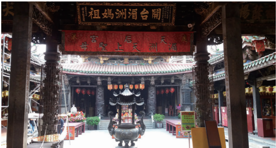
鹿港天后宮至今將近四百年歷史，為國定古蹟。