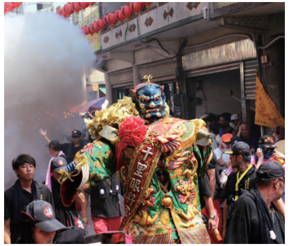
進香時，媽祖的首席護駕千里眼及順風耳也會隨侍在轎旁。