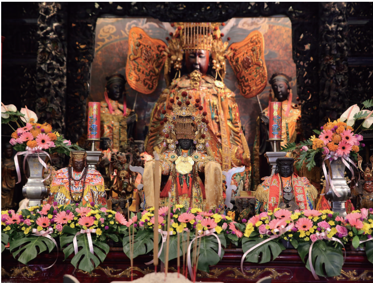
西螺福興宮的太平媽，是臺灣唯一在秋季舉行的媽祖遶境活動。