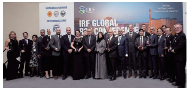
台 61 線八棟寮至九塊厝路段榮獲 2019 年全球唯一「全球道路成就獎」中的環境減輕類首獎。

台 61 線在興建過程中見證了臺灣近代的社會變遷。隨著環境意識提升，在硬體建設的基礎上，也加入了注重臨海生態地景及歷史文化的軟體思維，展現了公路建設與環境價值嘗試取得平衡的永續精神。而西濱快速公路完成後，路線連接西部沿海重要港口、工業區、觀光休憩景點等，且為不收費的快速道路。因此可預期成成為與國 1 及國 3 的替代道路，有效疏解車流，成為臺灣第三條活絡經濟、發展觀光的重要城際運輸幹道。