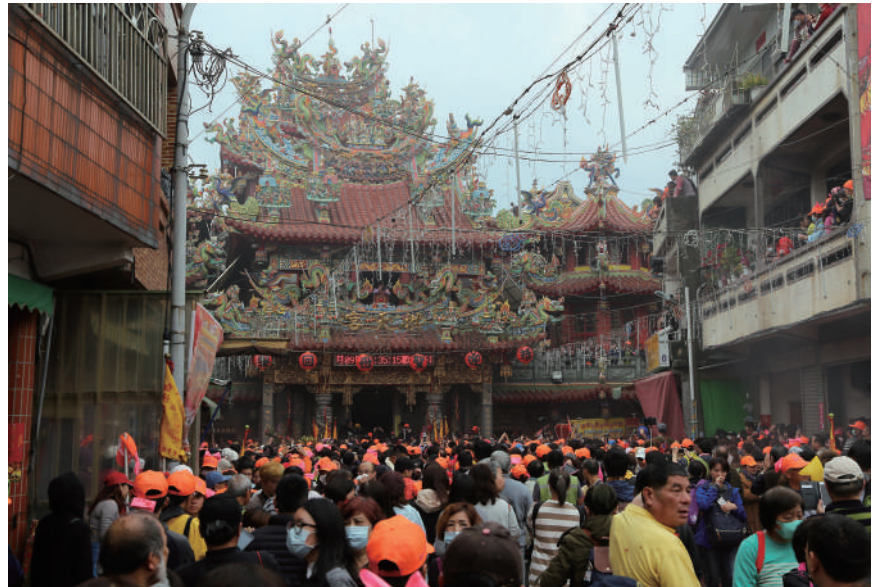
白沙屯媽祖進香時，不論男女、種族，均可參與扛轎。