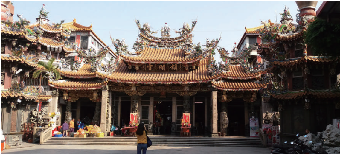
大甲鎮瀾宮全年香火鼎盛，信徒絡繹不絕。