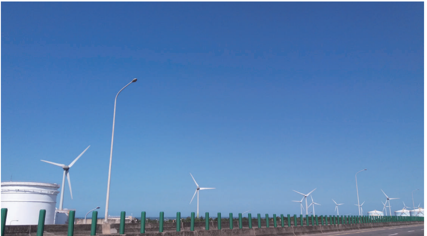
連綿的白色風力發電風車景觀，已成西濱快速公路的一大特色。