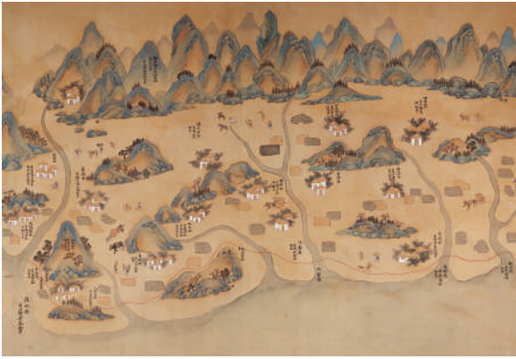
「康熙臺灣輿圖」正是台 61 線接駁過去和未來的基礎。 (國家重要古物／國立臺灣博物館提供)

台 61 線，西濱快速公路，北起新北市八里區，南至臺南市七股區，全長約 308 公里。全程緊貼著海岸線，臺灣海峽的波光潾潾，一路相伴。打破了以往以陸地為重心，對海洋則保持防堵的姿態。低打擾、低破壞、低侵犯，與沿岸生態保持微溫小距離。為的是讓人們擁有行的方便，然後重新與海洋立約——找回昔時先民以海洋為中介的開拓精神。來吧，重新認識它，擁抱它，這屬於我們的海。