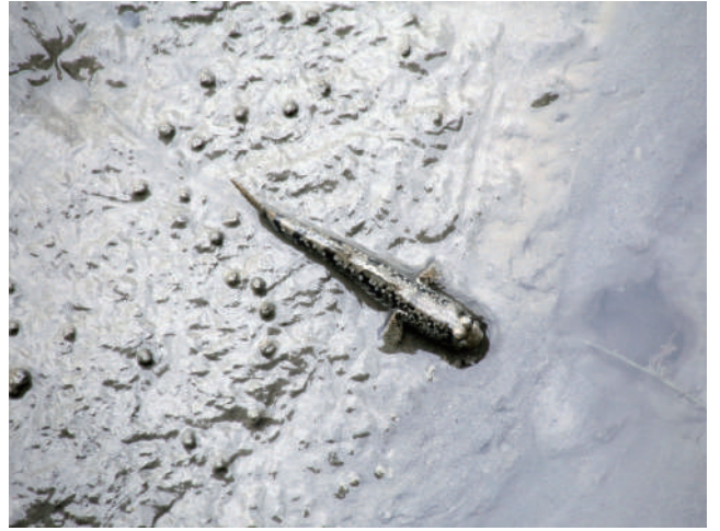
西濱沿線是觀察濕地生態的最佳地點。