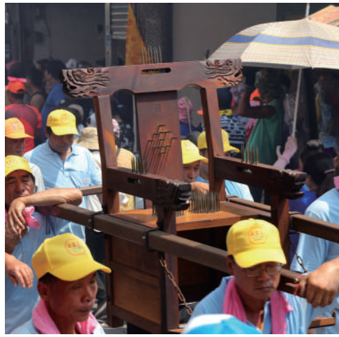
隨行的「香丁腳」要協助接替扛神轎或頭旗。