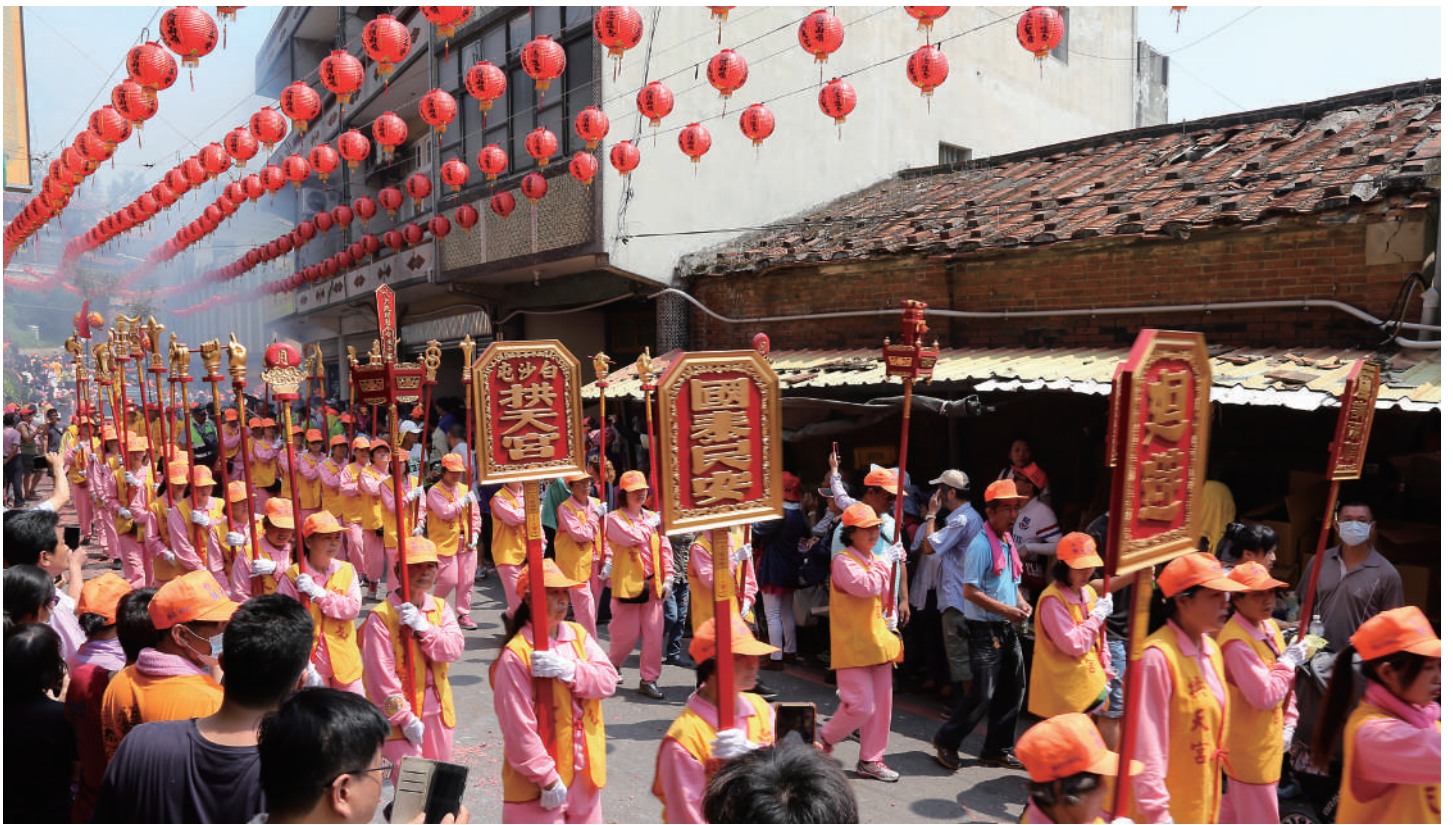
白沙屯媽祖徒步進香為全臺距離最長的進香活動。