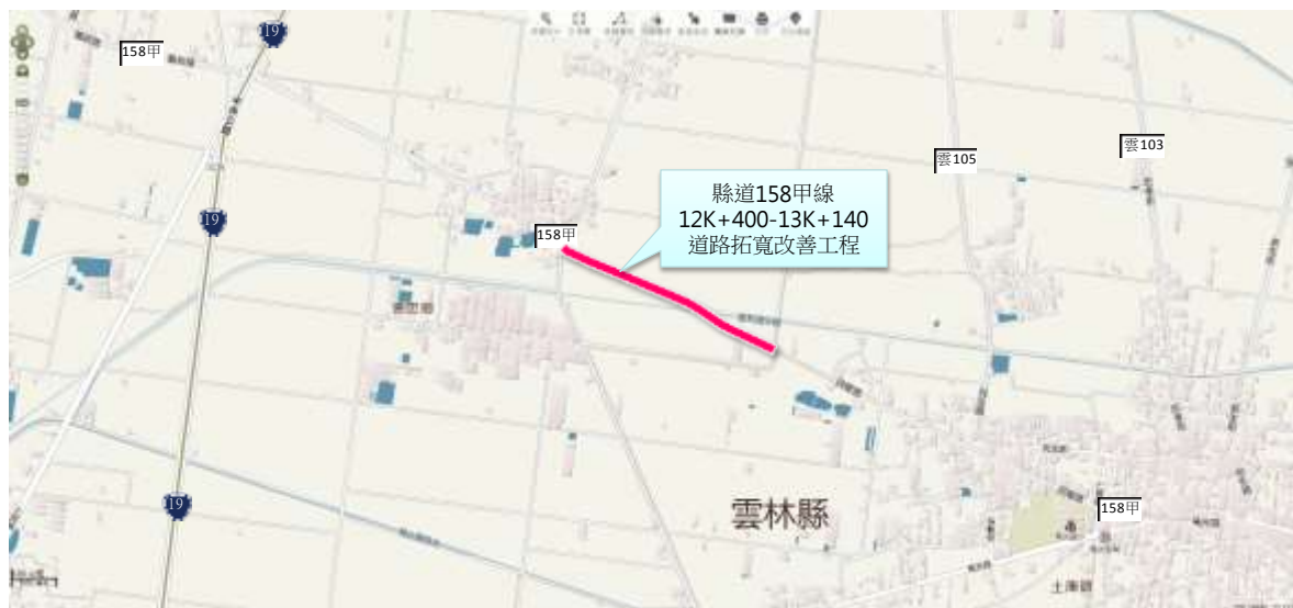
圖 3 計畫道路工程位置圖