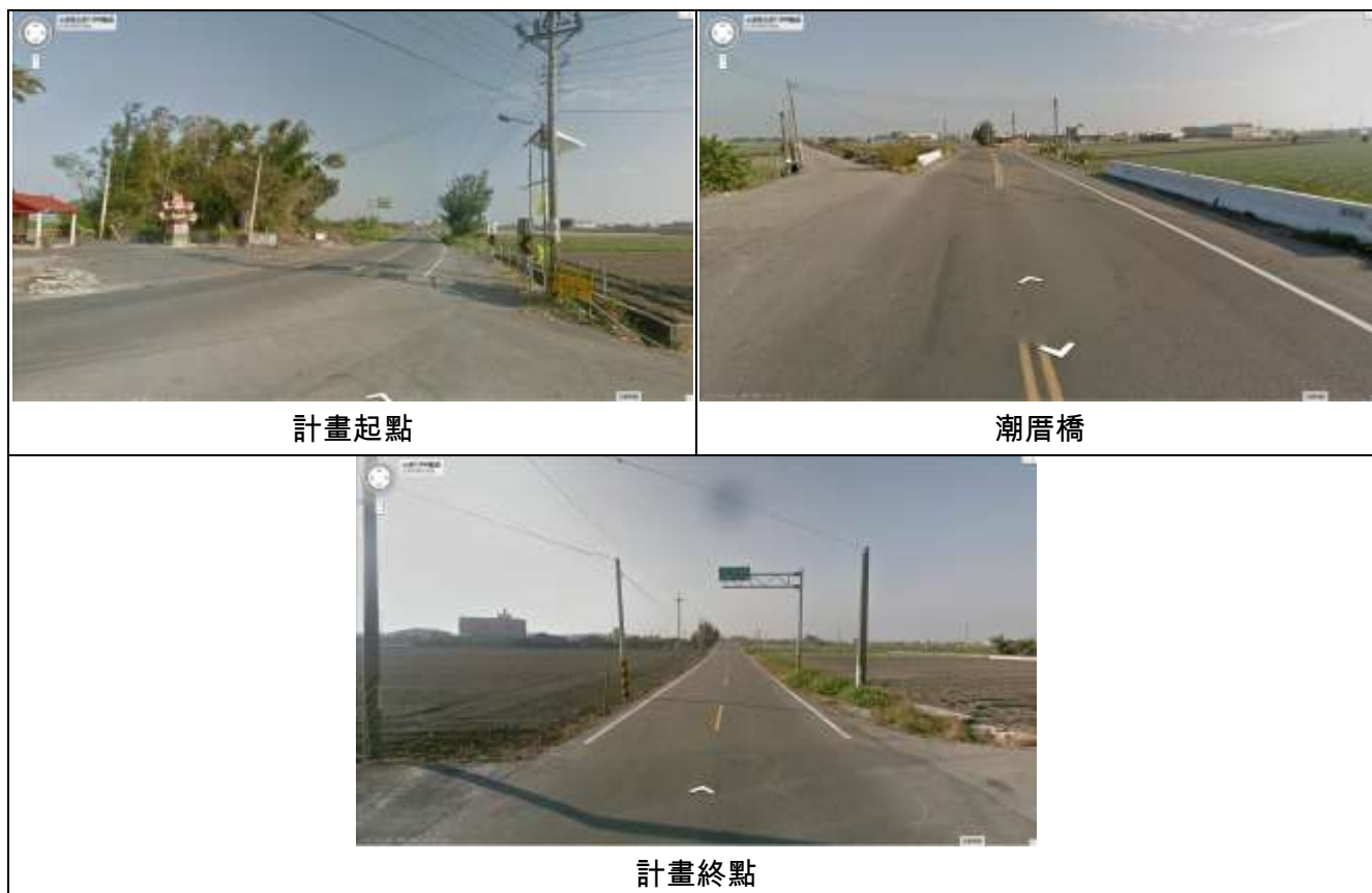
圖 2 計畫道路現況