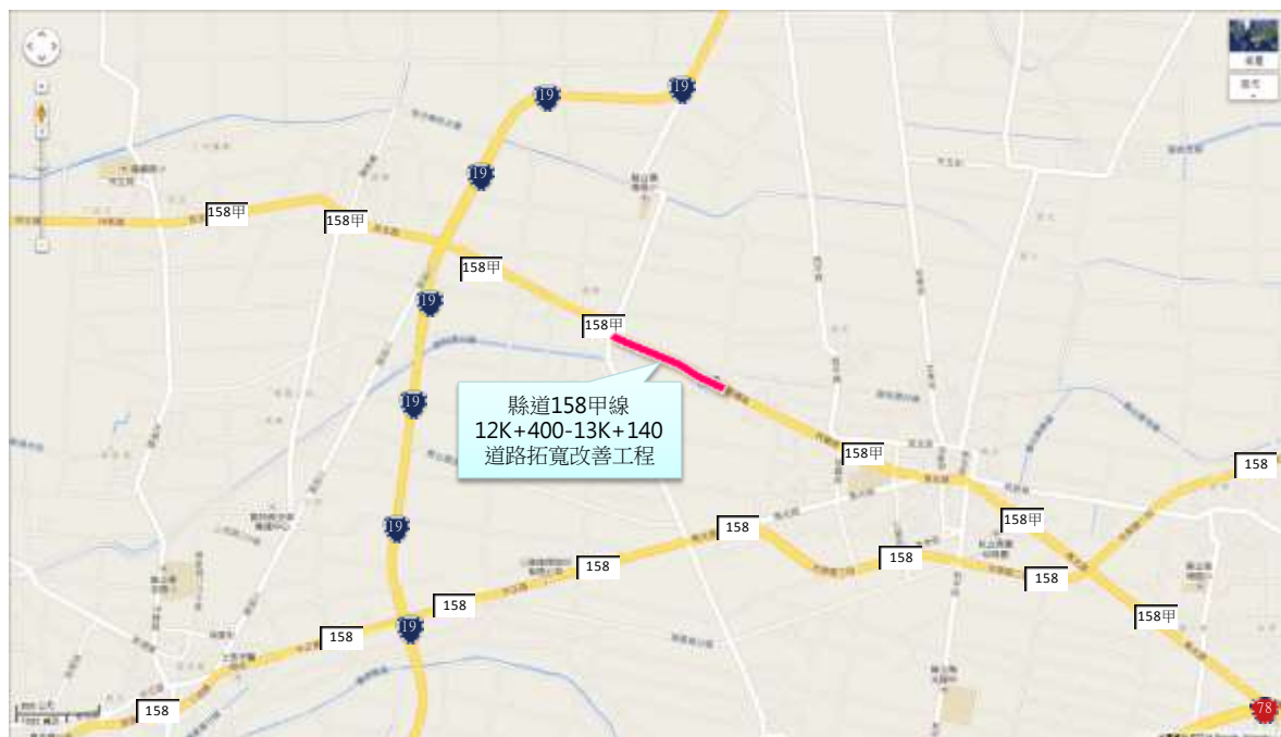
圖 1 計畫周邊道路系統

至於現況服務水準部分，根據雲林縣政府 102 年道路交通量調查結果，縣道 158 甲線鄰近新興橋路段尖峰小時服務水準為 A 級。