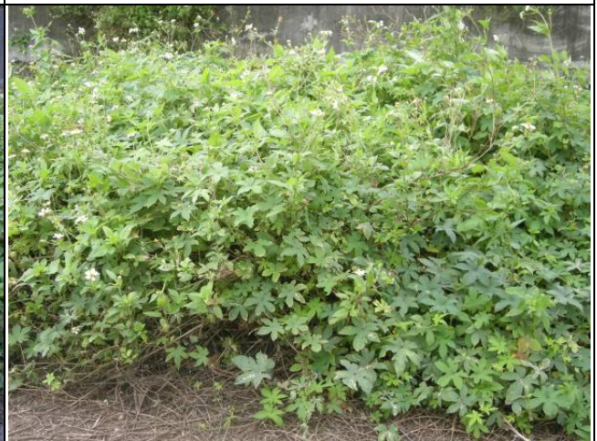
樣區四 12月優勢種為大花咸豐草