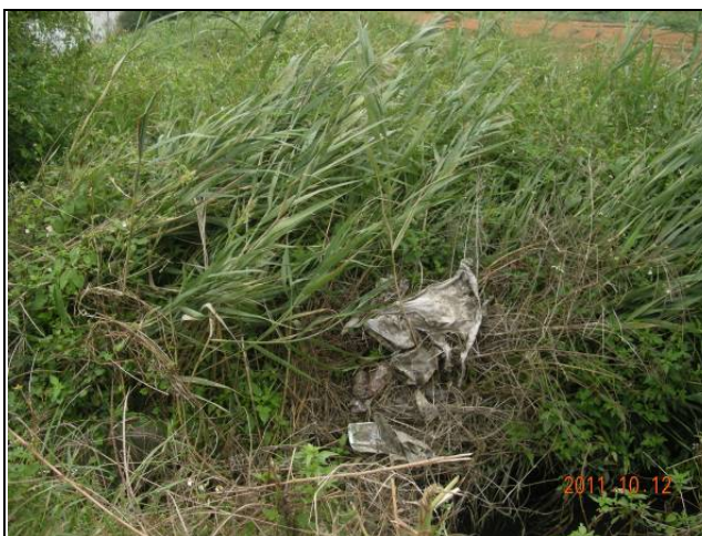
樣區五 10月覆蓋度因干擾變低