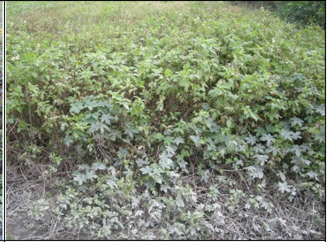
樣區二 12月優勢種為大花咸豐草