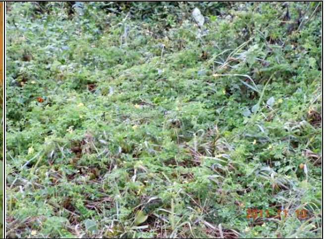
樣區一 11月以大花咸豐草為優勢