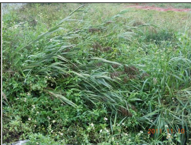
樣區五 11月以蘆葦為優勢