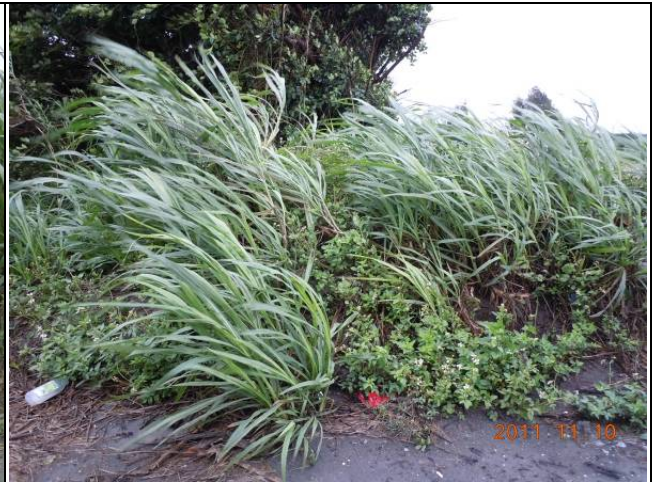
樣區三 11月以象草為優勢