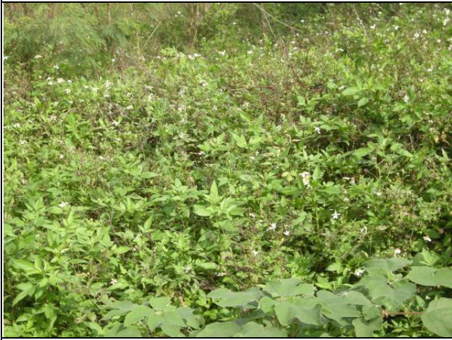
樣區一 12月以大花咸豐草為優勢