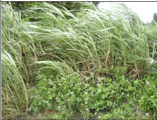
樣區三 12月以象草為優勢