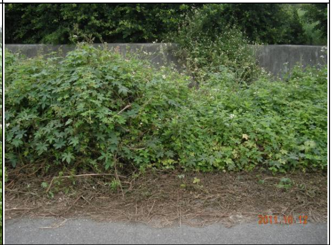
樣區四 10月優勢種為大花咸豐草