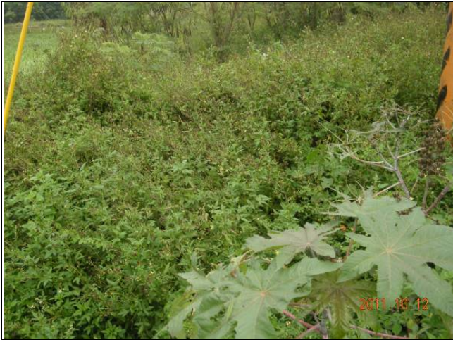
樣區一 10月以大花咸豐草為優勢