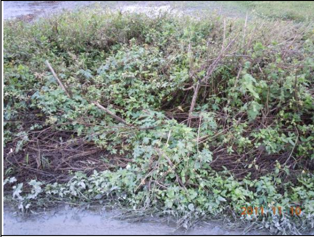
樣區二 11月以大花咸豐草為優勢