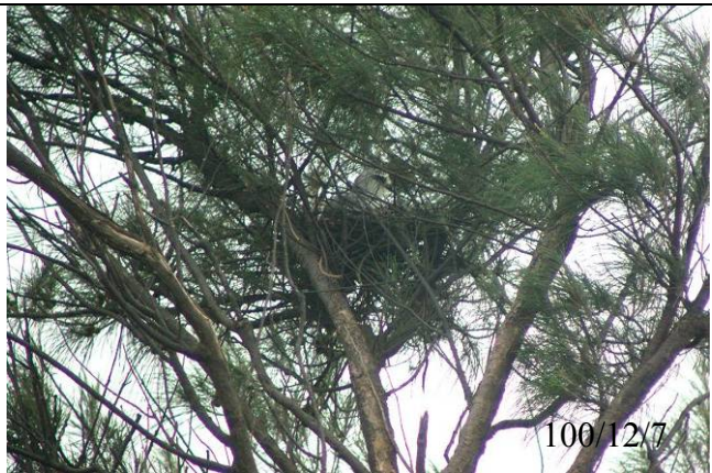
生物照-黑翅鳶巢位