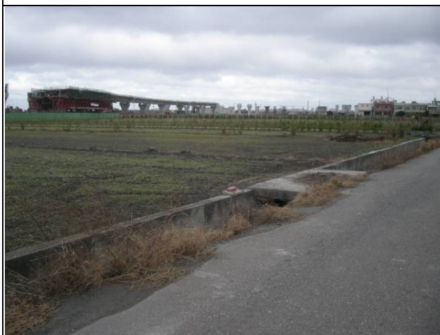
計畫區的農耕地目前處休耕期