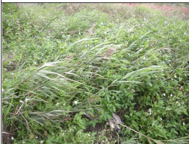
樣區五 12月以蘆葦為優勢