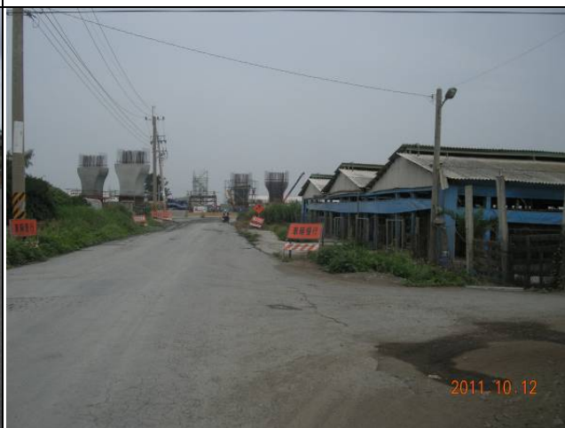
自生型植物多生長在道路兩旁