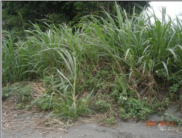
樣區三 10月以象草為優勢