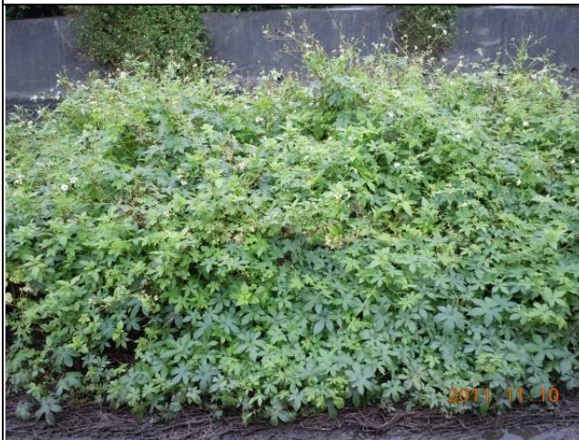
樣區四 11月大花咸豐草為優勢