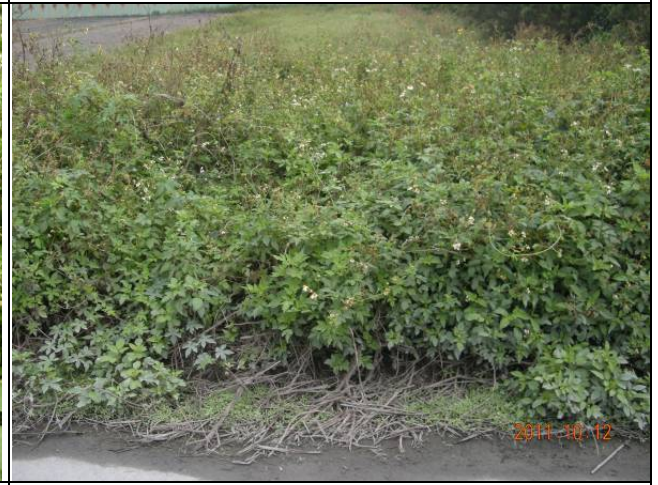
樣區二 10月優勢種為大花咸豐草