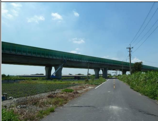
計畫區附近的環境照