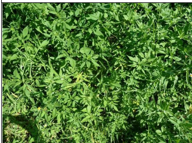
樣區一 9月以大花咸豐草為優勢