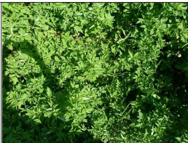
樣區一 8月以大花咸豐草為優勢