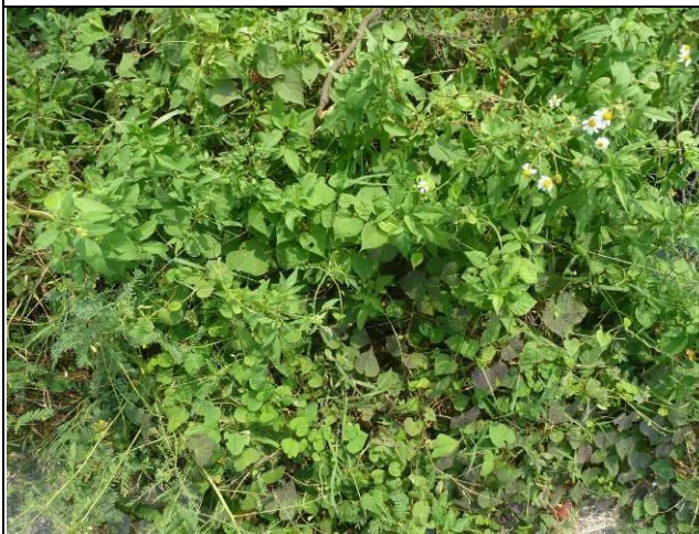
樣區五 9 月以大花咸豐草為優勢