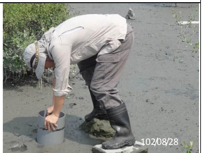
工作照-底棲生物調查