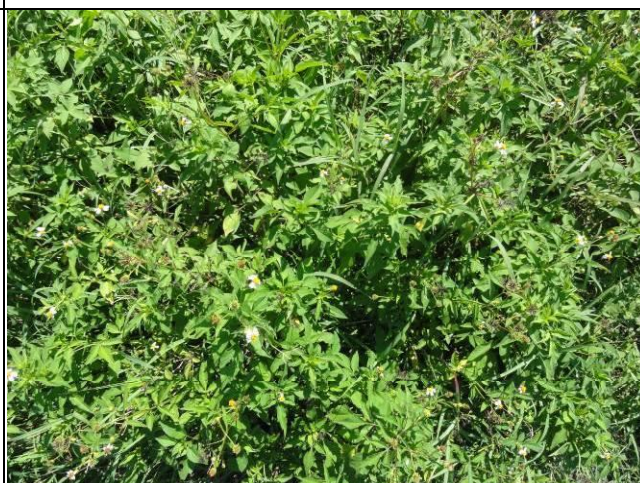
樣區二 7月優勢種為大花咸豐草