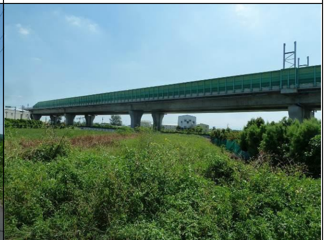
道路旁的自生型植物