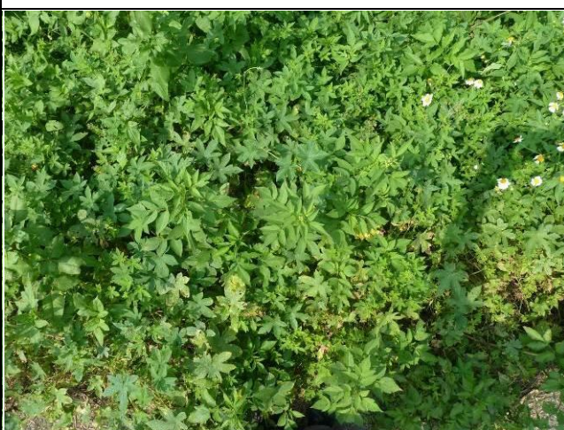
樣區四 9月優勢種為大花咸豐草