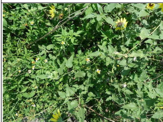
樣區二 8月以大花咸豐草為優勢