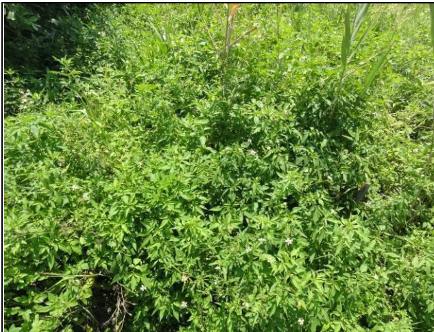
樣區五 7 月以大花咸豐草為優勢