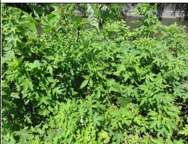
樣區四 7月優勢種為大花咸豐草