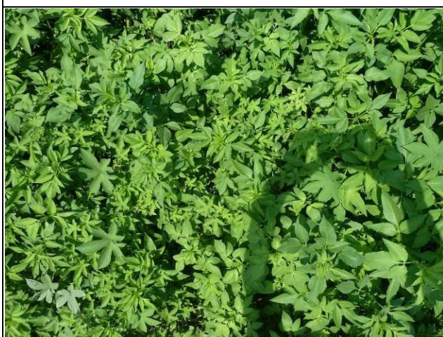
樣區四 8月大花咸豐草為優勢