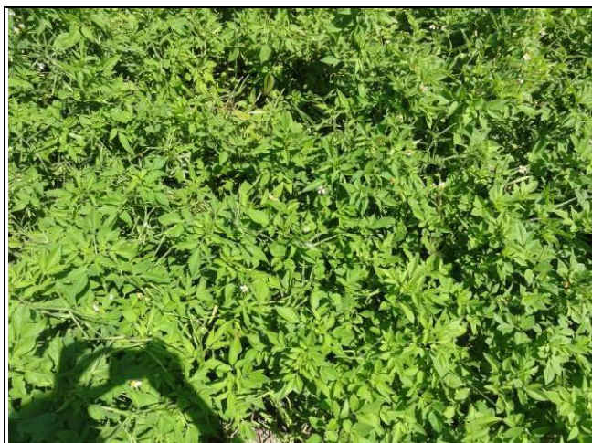
樣區一 7月以大花咸豐草為優勢