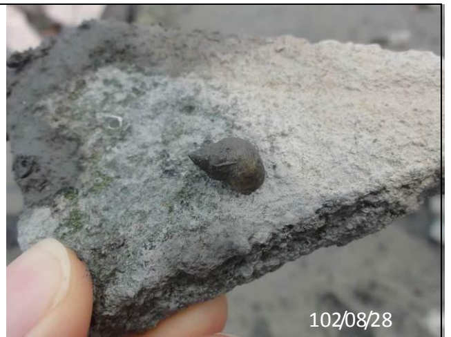
生物照-粗紋玉黍螺