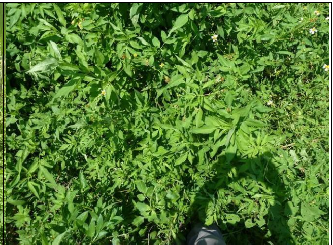
樣區五 8 月以大花咸豐草為優勢