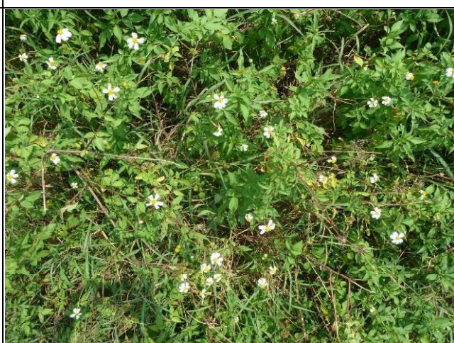
樣區二 9月以大花咸豐草為優勢