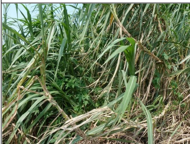
樣區三 9月以象草為優勢