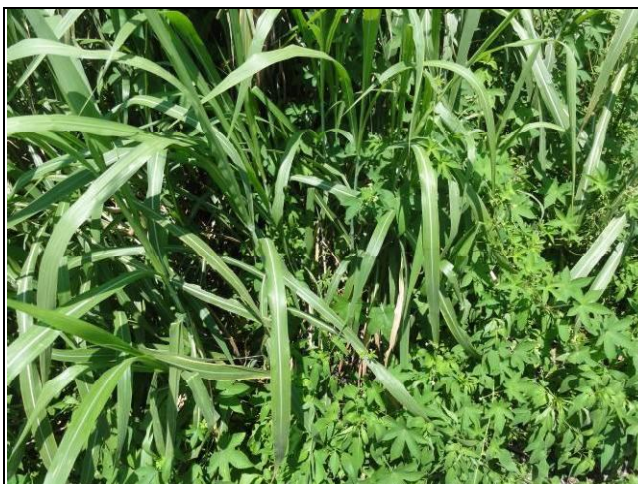
樣區三 7月以象草為優勢