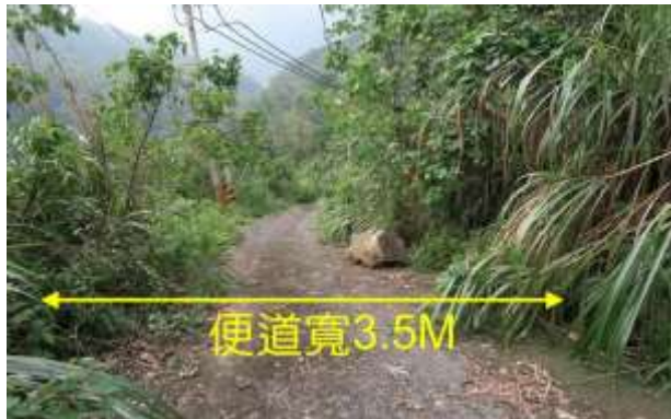
▲崩塌區域開闢便道暫時通行