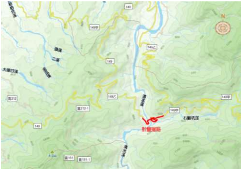
圖 3 計畫周邊道路系統

縣道 149 乙線北起南投縣竹山鎮內寮，南至雲林縣古坑鄉外湖，全長共計 8.87 公里，是竹山往草嶺的聯絡道路，該路段位於古坑鄉境自 5K+047 處(與南投縣竹山鎮內寮部落相接)至 8K+869 處(草嶺村外湖部落與 149 甲線相接)。縣道 149 乙線位於牛奶科路段現況尖峰小時交通量調查結果雙向合計僅 144 PCU，服務水準為 A 級。