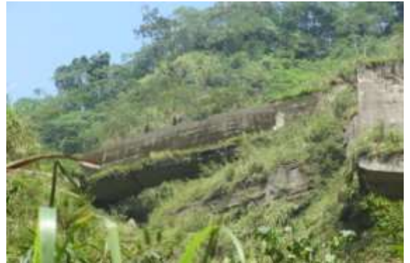
▲道路路基崩滑導致道路中斷