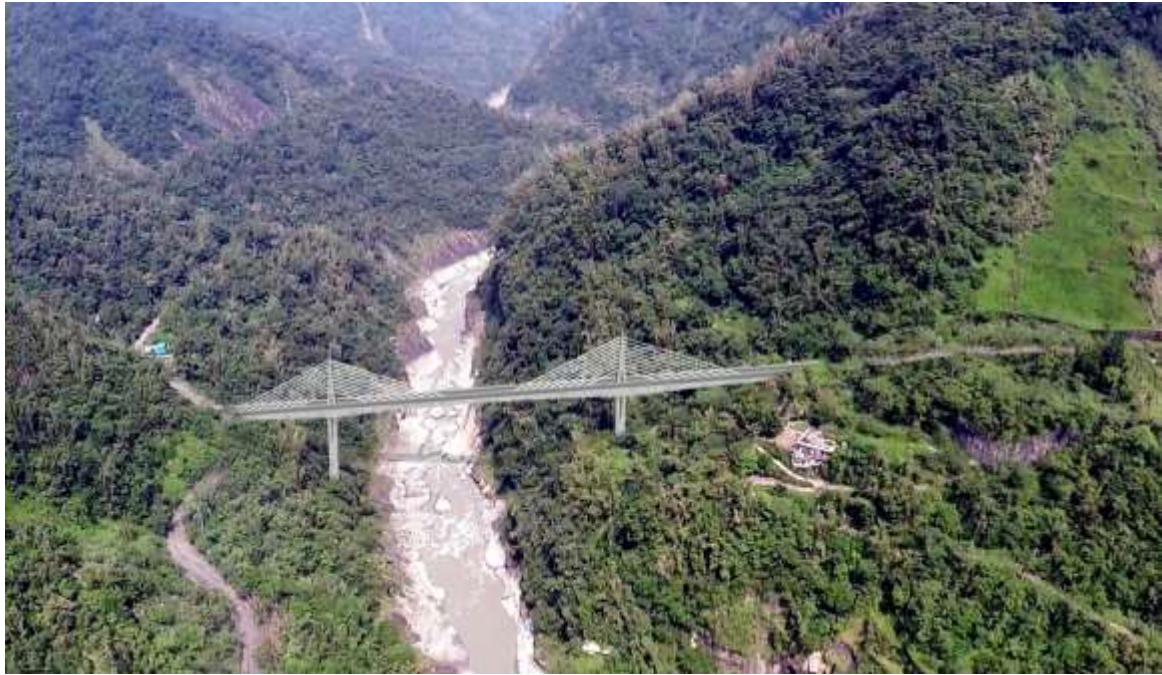
圖 7 計畫道路景觀規劃示意圖