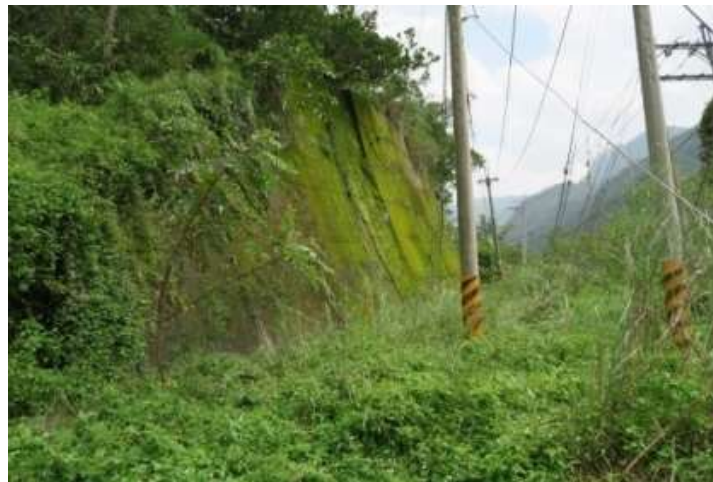
▲道路因多年未通行已布滿植生