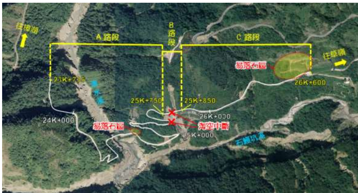
圖 2 計畫路線分段圖