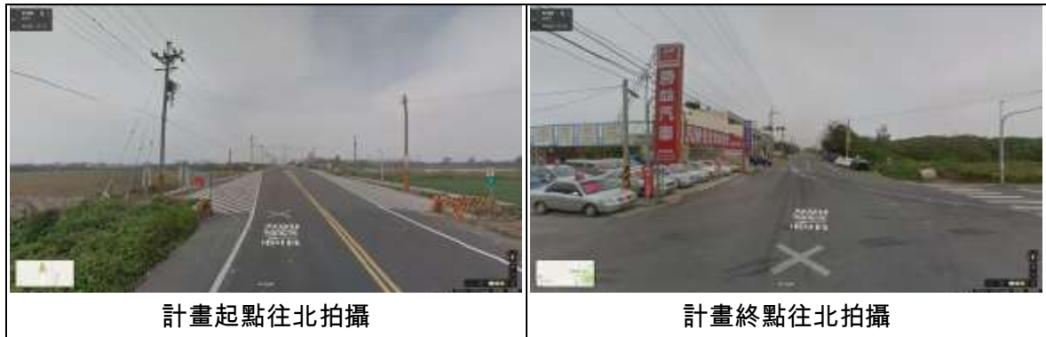
圖 2 計畫道路現況