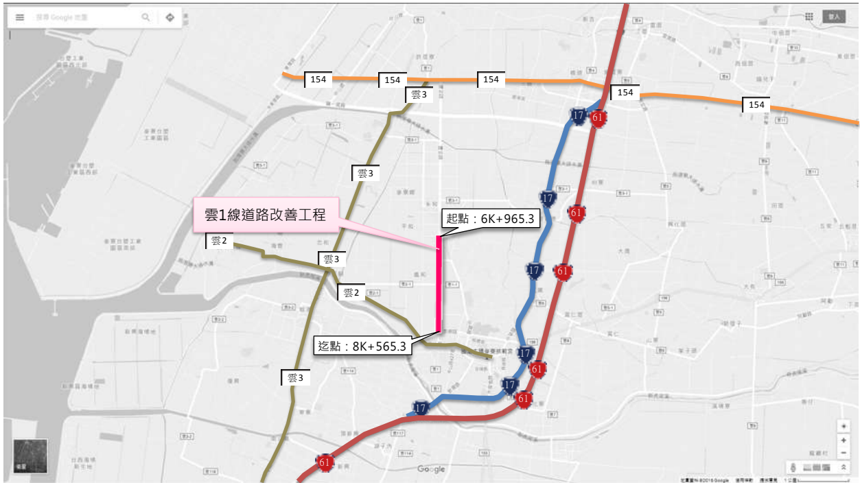
圖 3 計畫道路工程位置圖