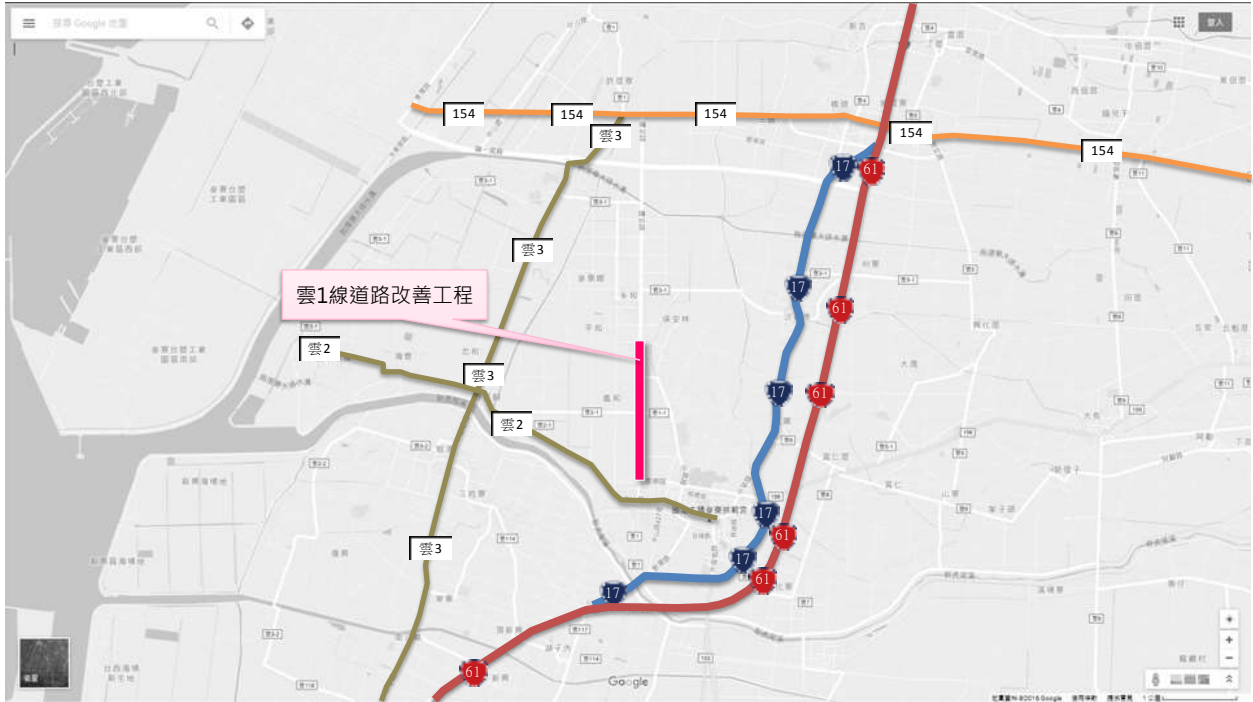
圖 1 計畫周邊道路系統

(二)與重要開發區、觀光景點、政經中心、產業園區、大眾運輸集結點或重要道路之連結情形