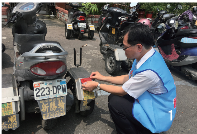
1 主動製作身障車輛反光貼紙

我們仍持續用心推展「 道路 交通秩序與交通安全改進方案」各項安全管理工作，努力為維護交通秩序、提升交通安全貢獻心力，以提升全體用路人行車安全，達到「人車平安」的終極目標。