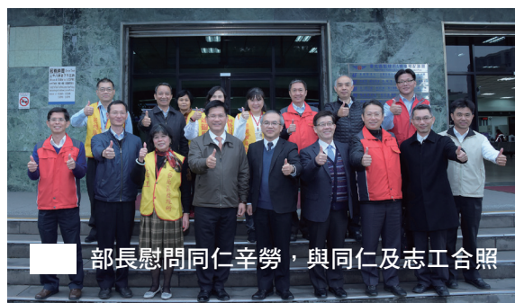
部長慰問同仁辛勞，與同仁及志工合照

林部長表示，政府務實面對因應國人在連假期間返鄉、收假及旅遊的需求，也理解客運要提高疏運量，排班需要彈性；但安全不容打折，要讓國人春節返鄉的安全無空窗，順暢又平安的過一個好年。