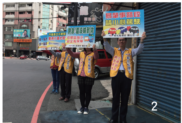
2 快閃舉牌交通安全宣導