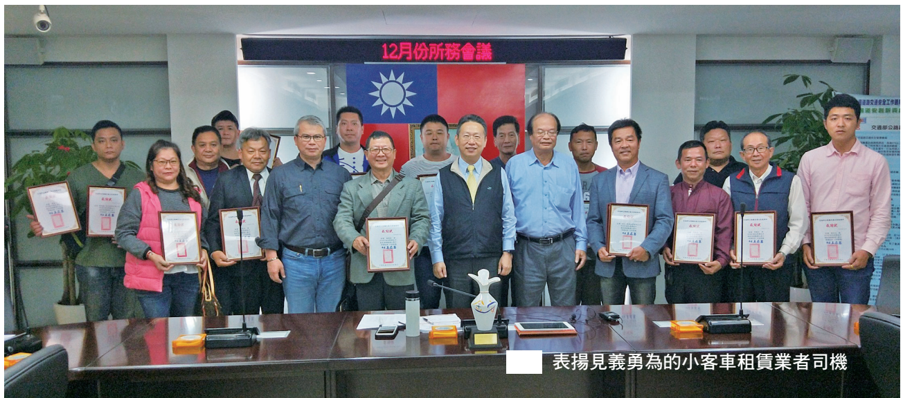
表揚見義勇為的小客車租賃業者司機