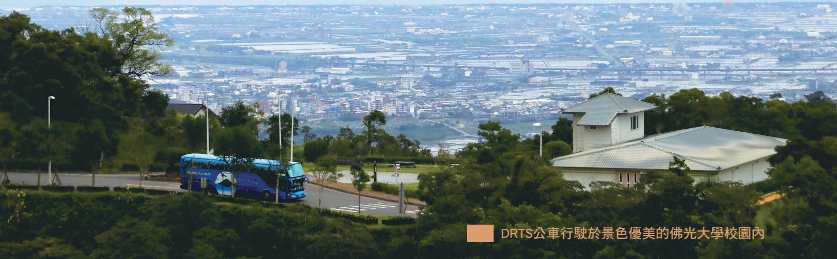
DRTS公車行駛於景色優美的佛光大學校園內