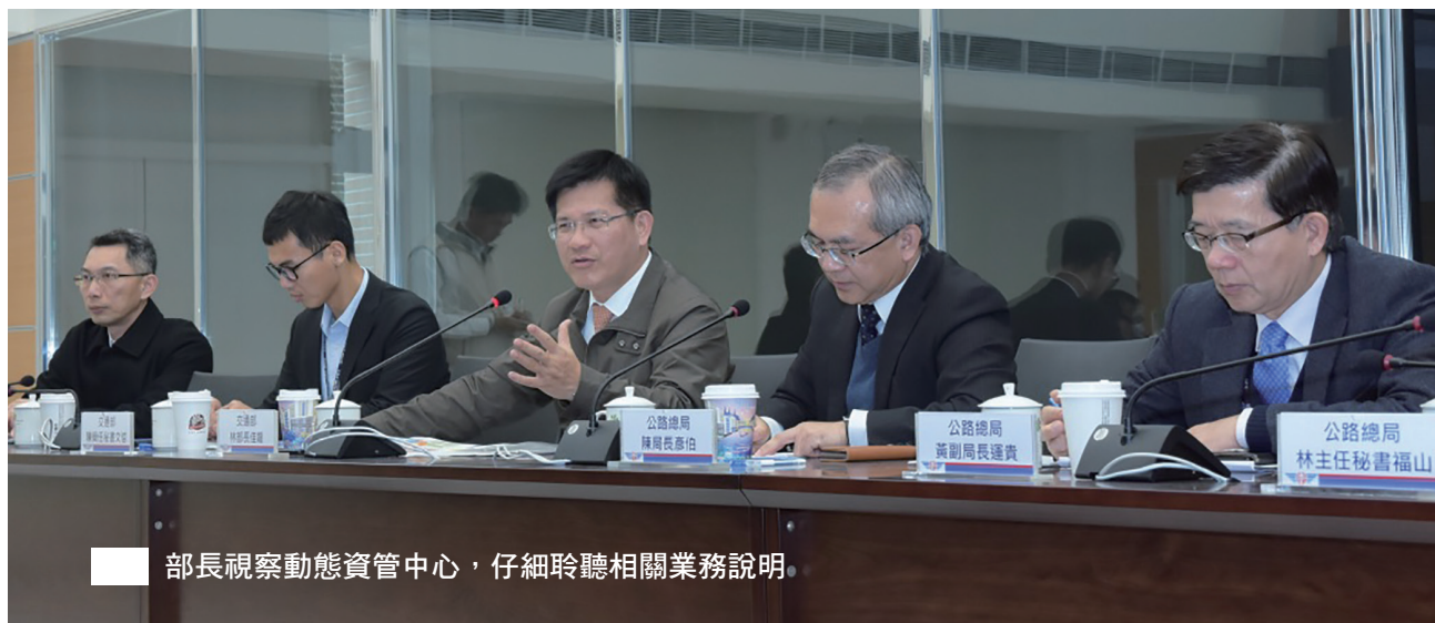
部長視察動態資管中心，仔細聆聽相關業務說明。