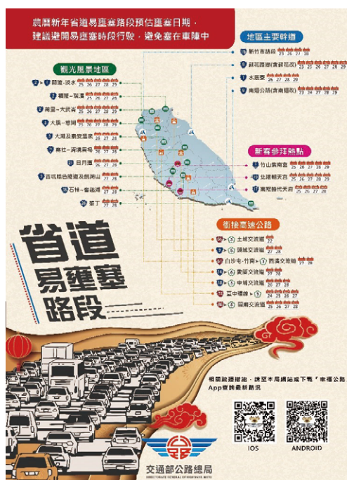
省道易壅塞路段宣導海報

假期開始前，公路總局先依車流特性及歷史資料研提出省道易壅塞路段共有24處，包括台9線蘇花改、南迴改及台61線西濱快速公路等新通車路段與各瓶頸路段，進行分析並研提相關疏導措施，如沿線號誌統一管理及調控、隧道內提速措施、台61線竹南路段封閉平交路口等，並特別於假期前製作行車宣導海報、懶人包，同時發佈新聞加強宣導，而各新通車路段於增加道路容量、提升行車速率及縮短旅行時間等方面皆有成效，減少交通壅塞情形。