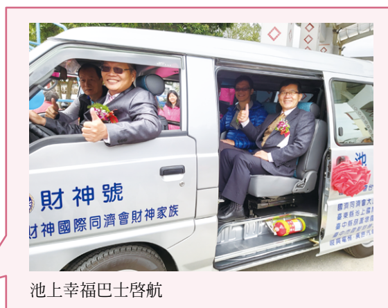
池上幸福巴士啟航

108年12月27日幸福巴士延伸至臺東縣池上鄉，正式宣告幸福巴士啟航服務。池上鄉服務路線分為固定及彈性預約路線，均為免費搭乘，固定路線主要是針對公路客運無法到達的部落，提供公車站點式運輸服務；