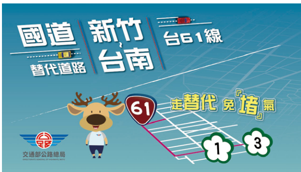
因應台61線西濱快速公路新竹—臺南全線通車並作為國道替代道路，公路總局製作行車宣導懶人包

假期中雖然部分觀光風景地區在尖峰時段仍有壅塞及車多的狀況，各區工程處皆依車流狀況立即執行各項疏運措施如規劃替代道路、彈性調撥車道、即時路況揭露及與警察單位合作立即執行疏導措施等，使壅塞路段及時段相較以往大幅改善，顯示各項疏運措施執行成效良好。