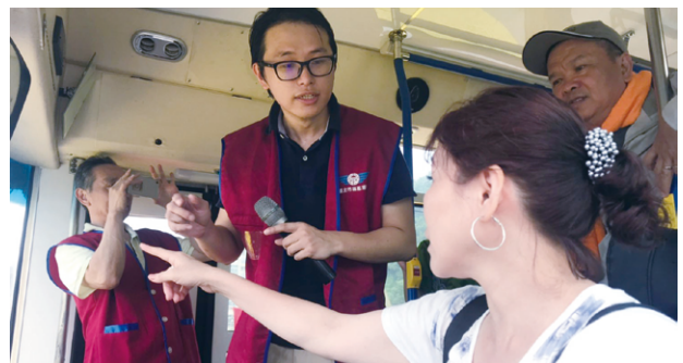
連江監理站辦理大型車視野死角與內輪差實地體驗活動

事故的發生往往都是一瞬之間，一時的疏忽將可能造成終生的遺憾。為避免憾事再次重演，無論任何時間、任何地點，在道路上行走、騎車或開車，除了應隨時與周邊車輛與行人保持安全距離之外，提醒民衆務必「遠離大型車」，只要時刻多一分的小心，你與身邊的人都將能獲得十分的安全與保障。