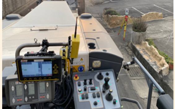
路側全測站自動追蹤