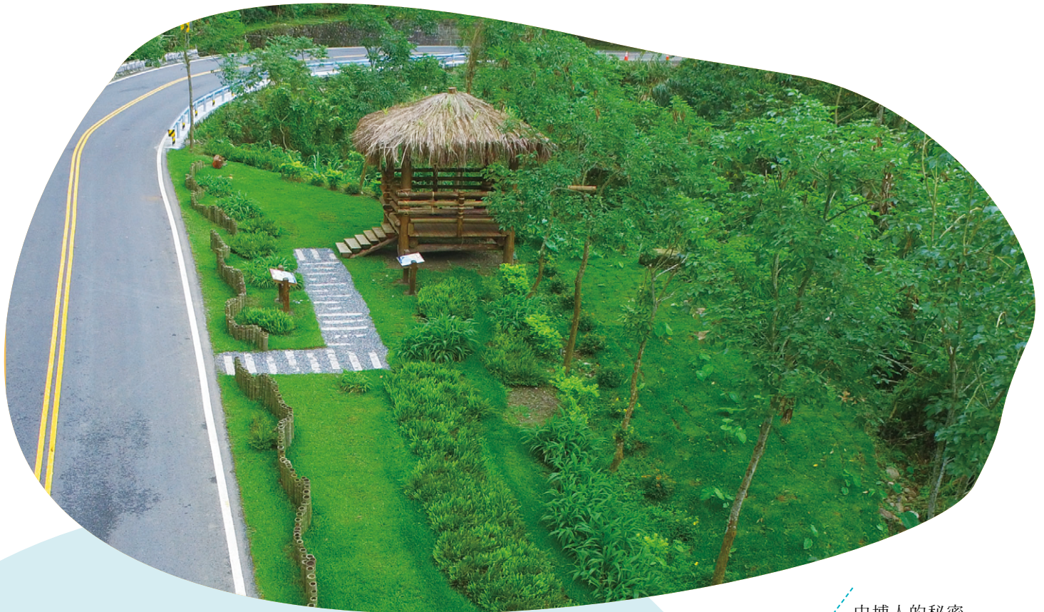
中埔人的秘密 花園—檳榔亭