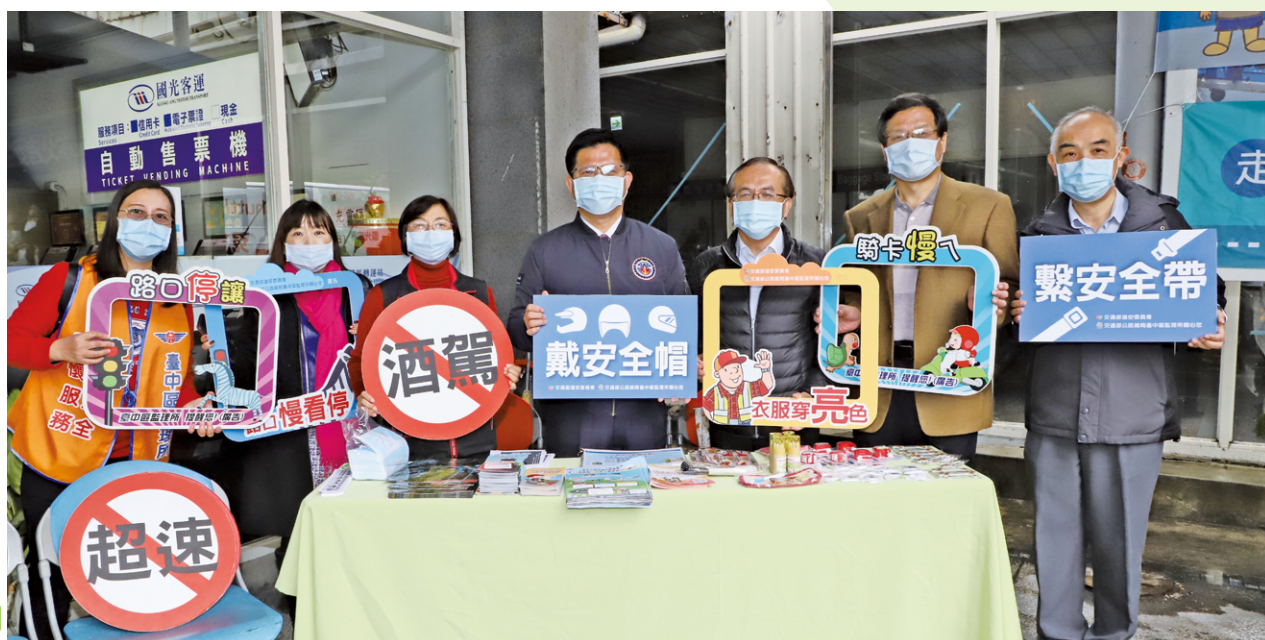
林佳龍部長至臺中朝馬轉運站視察疏運情形

109年春節連續假期有7天，公路總局自109年1月22日下午至109年1月29日止，執行春節連續假期交通疏運計畫。