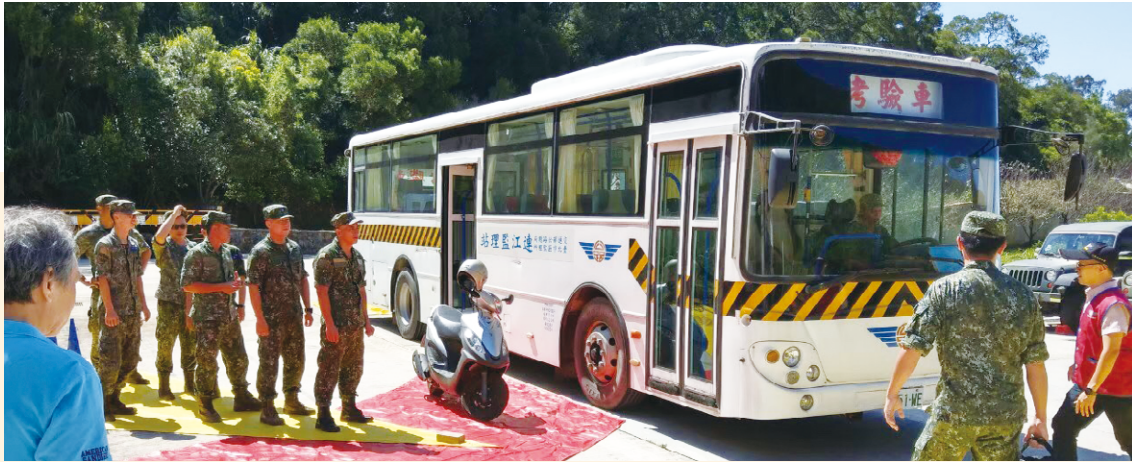
國軍弟兄於連江監理站進行大型車視野死角與內輪差實地體驗