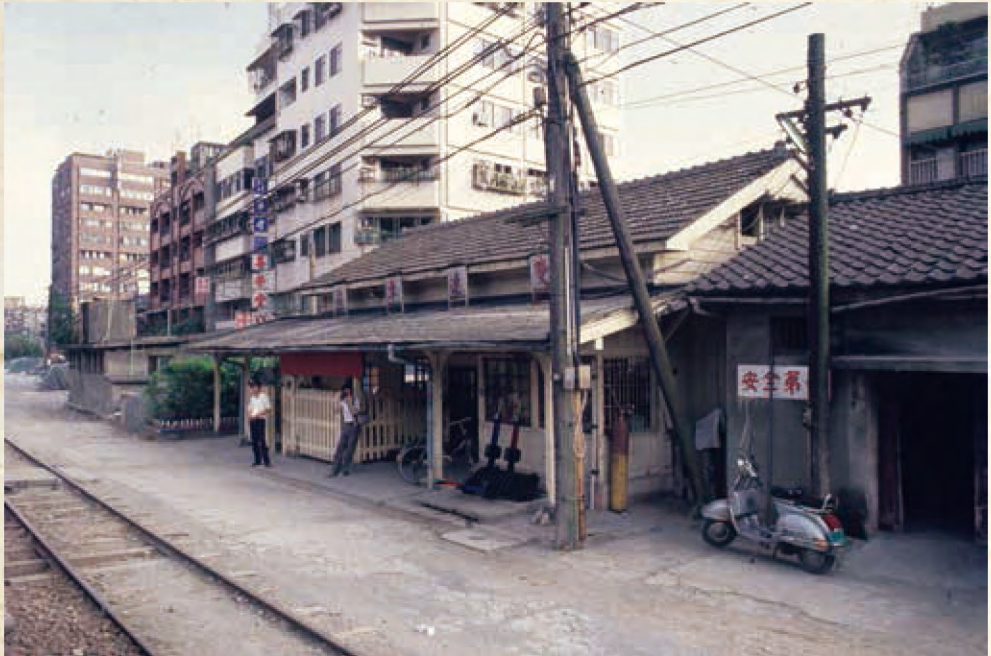
雙連火車站（今萬全街與萬全街1巷交會口附近），臺鐵淡水線停駛前的最後巡禮，攝於1988年7月。