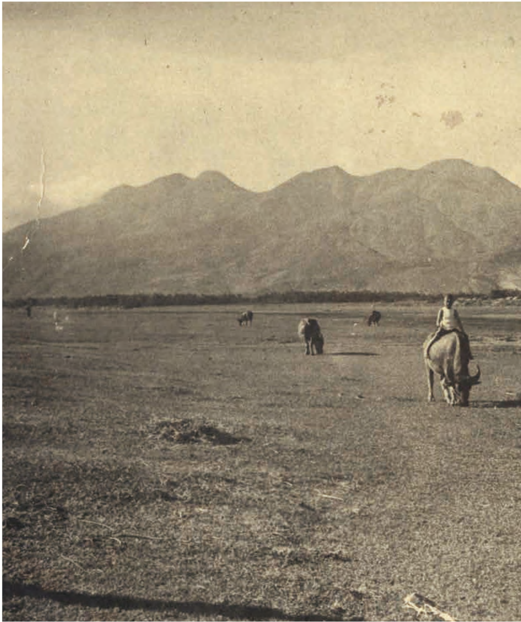
可以放牛的臺北市原野，小孩騎坐水牛背上，後方是基隆河岸，遠景是大屯山、小觀音山、七星山，約1920年代。這位置大約在今德惠街、農安街一帶，也就是第一區工程處第一工務段附近，昔名牛埔庄，是很貼切的地名。