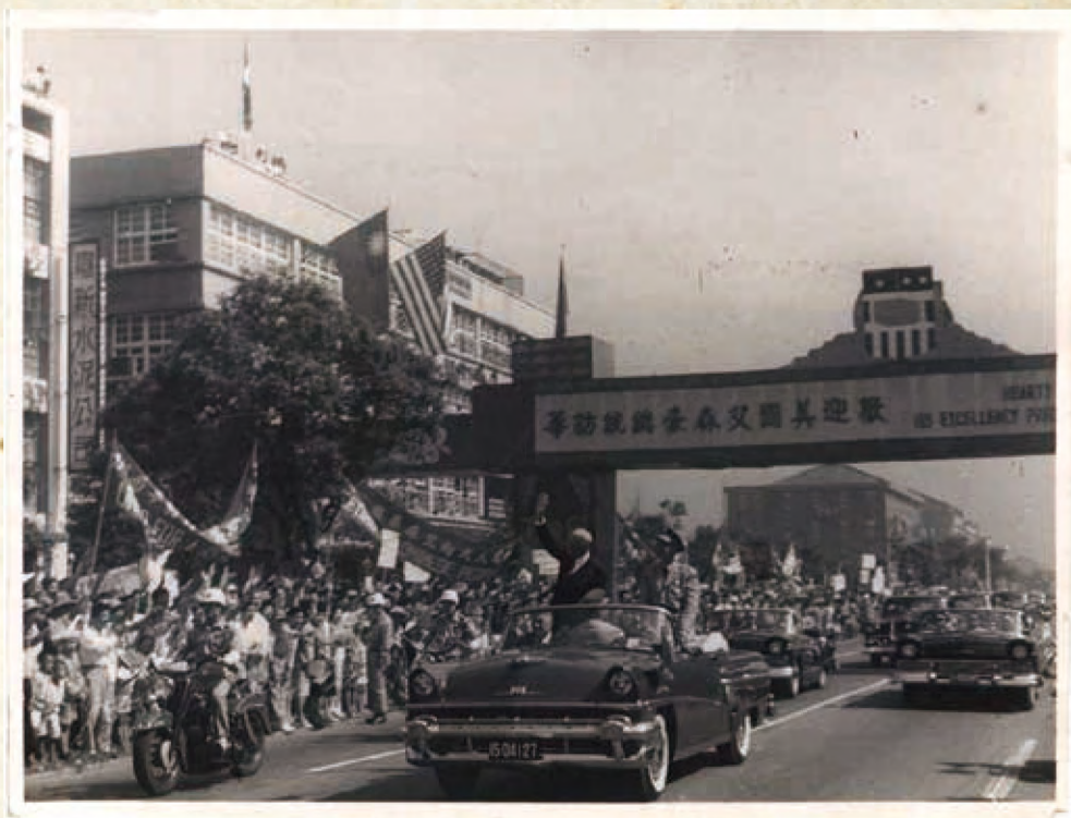
艾森豪總統在圓山大飯店稍事休息，然後往總統府而去，先過中山橋南行，車隊通過第一代嘉新水泥公司附近(今中山北路二段24號)，牌樓寫著「歡迎美國艾森豪總統訪華」，1960年6月18日。