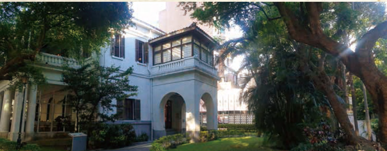
光點臺北，近南京西路的中山捷運站。白色的二層洋樓，最初是美國駐臺北領事館，後為美國駐華大使的官邸，現為文藝青年欣賞電影的地方，左側空間供應香醇現泡的咖啡。