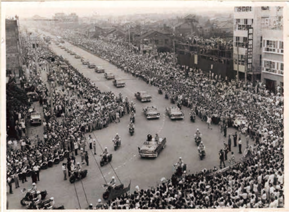
艾森豪總統車隊從松山機場出來，沿敦化北路南行，向西轉至南京東路前行，至中山北路北行，往圓山大飯店而去，沿途民眾歡呼，1960年6月18日。