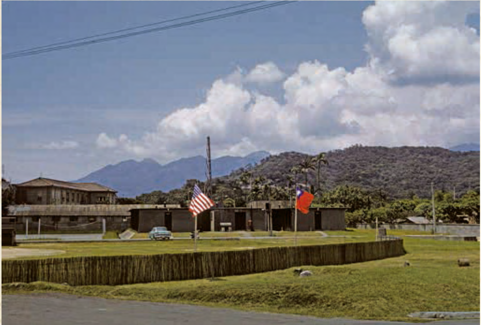
民族東路以北的美軍通信中心，草地上的中美國旗正飄揚。左後方的二層樓建物為美軍協防臺灣司令部（USTDC），遠處為大屯山，1957年。