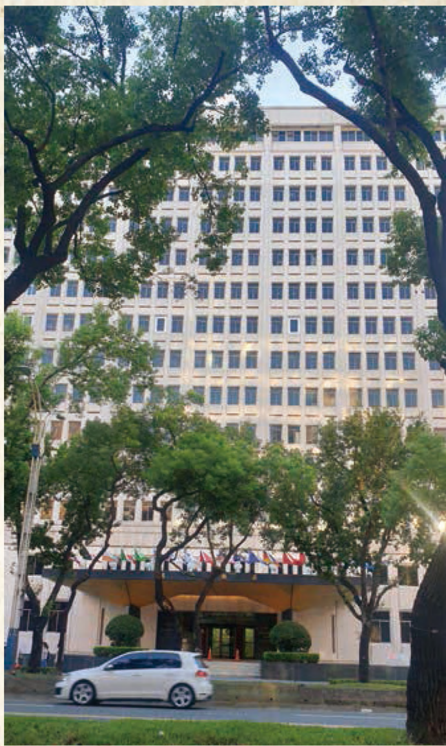
15層高的嘉新水泥大樓位於民權西路與民生西路之間，入口玄關上方掛滿各國的國旗，1967年完工。當年是臺北市最高的建築物，亦為中山北路最氣派的商辦大樓。