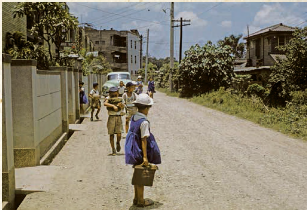
這是民族東路以南的中山北路三段55巷，孩子們正往中山國小的路上。租給美軍的二層樓水泥公寓在巷子左側（南側），右側有一條大水溝，1957年。