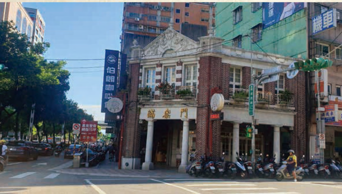
滿樂門，仿巴洛克風格的二層紅磚建物，座落在車水馬龍的長安西路口，與周遭的大樓相比，特別顯眼。