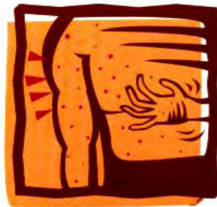
發燒 3-4 天，身上出現紅疹