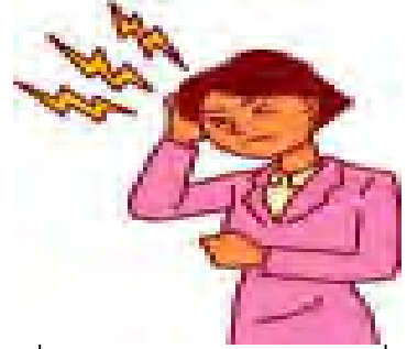
疼痛 (頭痛、後眼窩痛、骨骼關節或肌肉痛)

(二)登革出血熱的臨床症狀，主要是發燒、頭痛、肌肉痛、嘔吐、全身倦怠、腸胃道出血、子宮出血、血尿和恢復期出疹等。登革出血熱與典型登革熱的症狀很相似，兩個最大的不同點是登革出血熱有 血漿滲出 的情形。當血漿滲出量很多時，病人就會發生休克現象。而登革出血熱發生血漿滲出的時間，大約是發燒將要退的時候，或是燒退之後 24 到 48 小時。