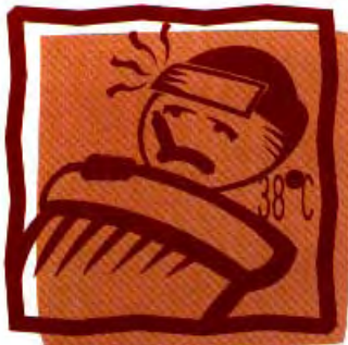
發燒到 38 度

(一) 典型登革熱的症狀有發燒(攝氏 38 度 C 到 40 度 C)或惡寒、皮膚出疹而且四肢痠痛、頭痛、後眼窩痛、骨骼關節或肌肉痛等等。