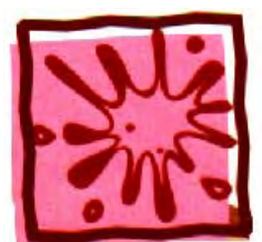
出血 (腸胃道及子宮出血、血尿)