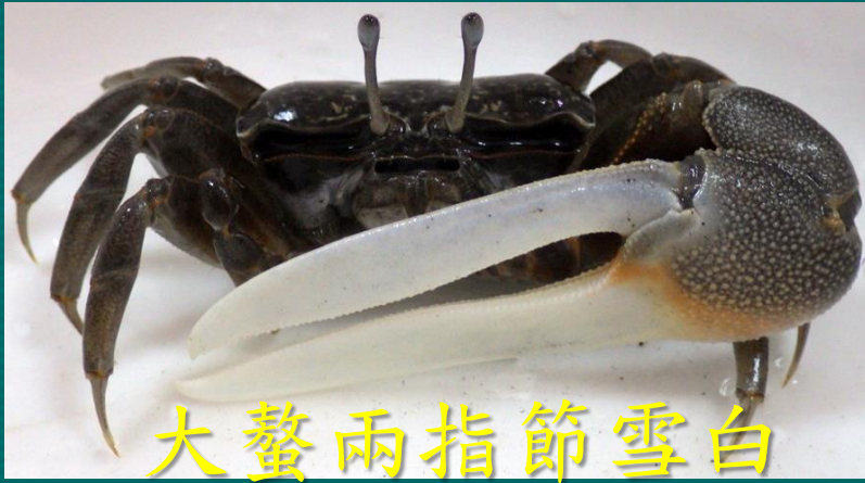
5. 台灣招潮蟹 (3.5cm)