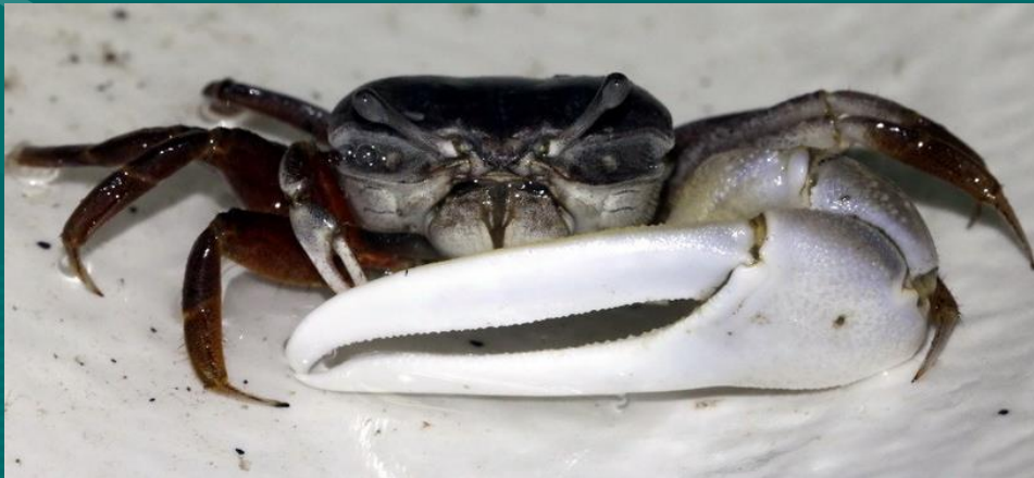
7. 清白招潮蟹 (1.5cm)