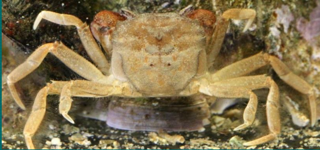
(11) 絨毛近方蟹 (60mm)