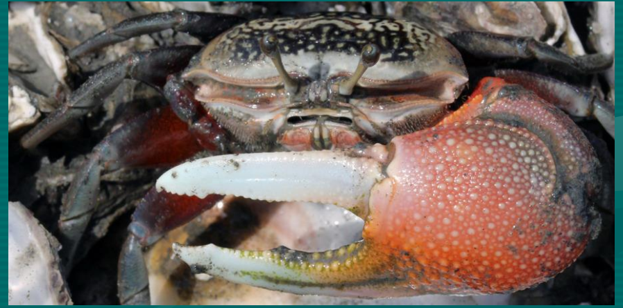
6. 網紋招潮蟹 (3.5cm)