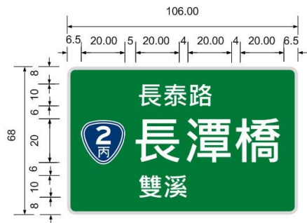
縮小型第1型 ( 路名、路線編號及橋名、跨越河川名 )