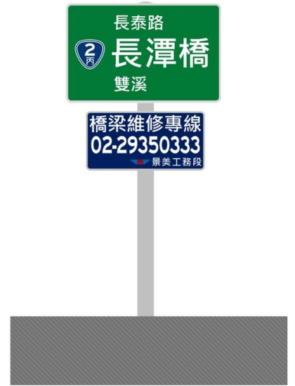
縮小型單柱設置示意圖