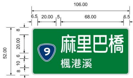
縮小型第2型 ( 路線編號及橋名、跨越河川名 )