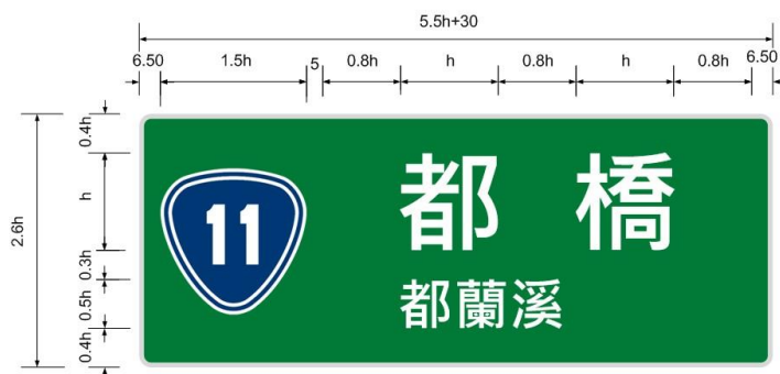
第2型（路線編號及橋名、跨越河川名）