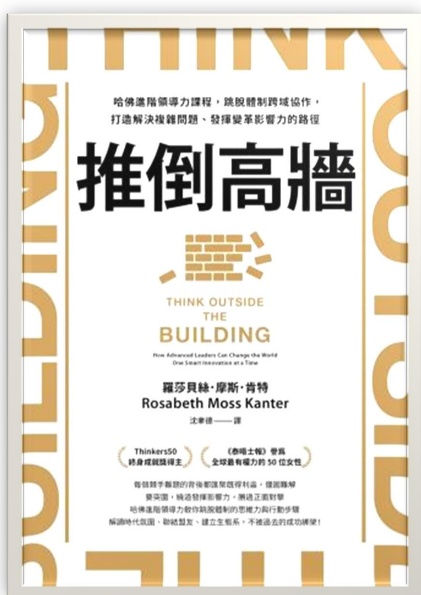
書名/推倒高牆 作者/羅莎貝絲·摩斯·肯特 出版社/天下雜誌 出版日期/2022

每個棘手難題的背後都有既得利益，僵固難解要突破，轉彎發揮影響力，在在勝過正面對擊。每一個劃時代的成功，都是打破體制創新的經典。現在的難題，就是等待新領導力推倒的高牆！本書整理出最有效的實踐指南，打造解決複雜問題的領導力典範：