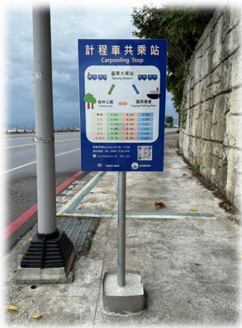
圖 1 富岡漁港